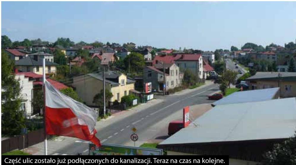
Część ulic zostało już podłączonych do kanalizacji. Teraz na czas na kolejne.

Urząd Miejski w Łazach zdecydowanymi krokami zbliża się do jednej z najważniejszych inwestycji jaką jest drugi etap budowy kanalizacji sanitarnej dla miasta Łazy. Rozpoczęcie prac budowlanych planuje się w 2015 roku. Do wykonania będzie prawie 35 kilometrów sieci kanalizacyjnej i około siedem pompowni ścieków wraz z ich zasilaniem energetycznym, monitoringiem dwóch etapów i zagospodarowaniem terenu. Efektem wyżej wymienionych prac będzie skuteczne odprowadzanie ścieków sanitarnych.