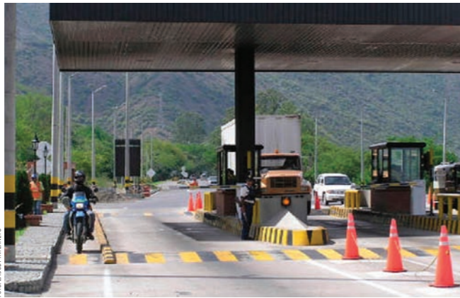
Eksperti wskazują, że koszt poboru opłaty za przejazd pomiędzy bramkami Sośnica a Rybnicka może wynosić ponad 25 groszy