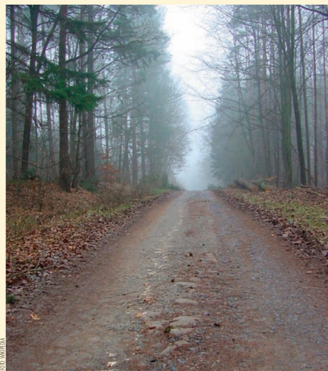
Fragment Via Regia między miastami Fulda i Neuhoﬀ

sługujące handel i bogacące się na nim. Nowe regulacje prawne, w tym przymus drogowy, prawo składu czy przywilej targowy, nakazujące kupcom poruszać się tylko określoną trasą i handlować wyłącznie w wyznaczonych do tego celu miejscach, stymulowały coraz intensywniejszy rozwój kolejnych ośrodków miejskich. W ten sposób na Górnym Śląsku wzdłuż Via Regia rozwijały się Opole, Toszek, Bytom, Piekary Śląskie. Bogacące się miasta stają się ośrodkami rozwoju kultury, nauki, sztuki. Zaś Via Regia staje się załącznikiem jedności Europy, na poziomie gospodarczym i ideowym.