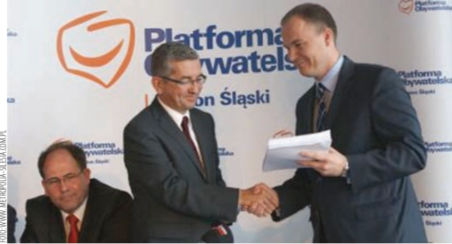
Wrzesień 2011: politycy Platformy Obywatelskiej prezentują projekt ustawy metropolitalnej

zwłaszcza PiS przyjęły rolę opozycji totalnej, krytykującej wszystkie poczynania rządu bez względu czy ma to sens, czy nie. Ludowcy od dawna nie kryją, że w ich przekonaniu metropolie zagrażą zrównoważonemu rozwojowi Polski i to w znacznej mierze z ich powodu prace nad ustawą metropolitalną spaliły na panewce w Sejmie poprzedniej kadencji. Także w szeregach PO dedykowana dla konurbacji katowickiej ustawa budzi szereg wątpliwości. Waldy Dzikowski, poseł Platformy z Wielkopolski, jest co prawda zwolennikiem usprawnienia funkcjonowania największych obszarów miejskich w Polsce, jednak najchętniej widziałby prace nad jednym uniwersalnym rozwiązaniem dla np. 12 największych miast. Możliwe zresztą, że podczas parlamentarnych prac ustawa z kresem polegnie w toku kłótni o metropolizację Rzeszowa albo Koszalina. Niestety, posłowie nie mają również świadomości, że wciskanie konurbacji katowickiej w ten sam model funkcjonowania metropolii jak w przypadku Poznania czy Trójmiasta, to błąd. Na Górnym Śląsku i w Zagłębiu Dąbrowskim mamy do czynienia z organizmem wewnątrznie złożonym, składającym się z miast o nieraz sprzecznych interesach, konkurujących ze sobą, jak np. Katowice z Gliwicami. Zresztą w przypadku Trójmiasta które obejmuje Gdynię, Sopot i Gdańsk również nie udało się wyeliminować pewnej rywalizacji pomiędzy poszczególnymi miastami. Stąd uzasadnione są obawy, że w przypadku metropolii śląsko-zagłębiowskiej może być