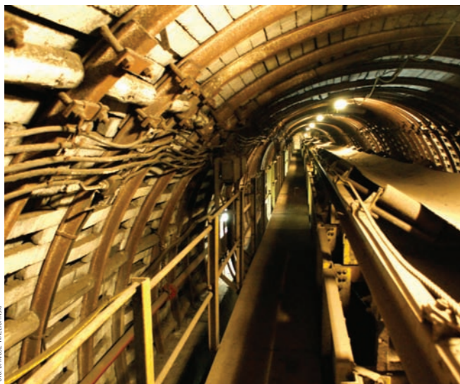
Zgodnie z ustawą wyrobisko górnicze nie podlega opodatkowaniu

Sam konflikt o rozliczenia podatkowe między gminami a spółkami górniczymi trwa jednak od lat 90. minionego stulecia. Wówczas to górnictwo usiłowało udowodnić, iż wyrobisko rozumiane jako pusta, trójwymiarowa przestrzeń w górotworze nie podlega opodatkowaniu. Zabiegi przedsiębiorstw górniczych zakończyły się sukcesem, gdyż taka interpretacja pojęcia wyrobiska oraz kwestii jego opodatkowania zo-