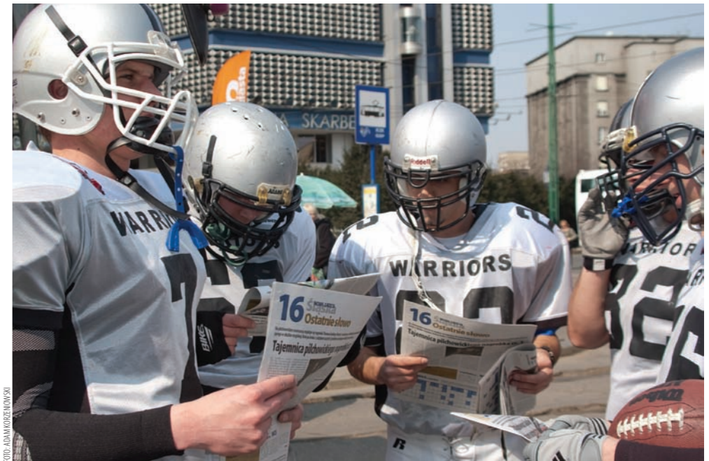
Zawodnicy Ruda Śląska Warriors wsparli promocję pierwszego wydania „Nowej Gazety Śląskiej”