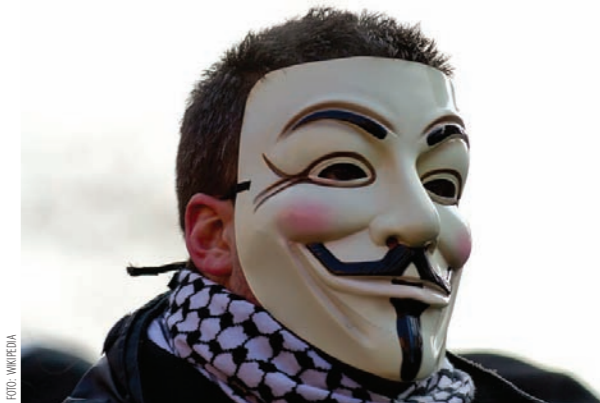
Zamieszanie wywołane podpisaniem ACTA nie ominęło także Śląska

we fora dyskusyjne, szybko zaczęto na nich prowadzić rozmowy o Śląsku, jego historii, kulturze, języku, ale również o jego przyszłości, w tym dążeniach do odzyskania autonomii. Z uwagi na ogromne zainteresowanie tą tematyką powstawały specjalne podfora poświęcone tylko i wyłącznie sprawom śląskim. Wreszcie osoby, które do tej pory podejrzewały, że ich poglądy i doświadczenie życiowe nie do końca są zgodne z tym co oficjalnie prezentują media i co naucza szkoła, mogły zobaczyć, że nie są same w swojej „odmienności”. Mało tego! Idee górnos Śląskiej autonomii, wcześniej nie wychodzące poza wąską grupę działaczy Ruchu Autonomii Śląska, zaczęły szybko zdobywać popularność, co – po kilku latach – doprowadziło do sukcesu wyborczego. Ślązacy zaczęli używać w internetowych dysputach swojego języka. Szybko dostrzeżli jednak, że polski alfabet niezbyt trafnie oddaje zawiloci śląskiej fonetyki. Dlatego