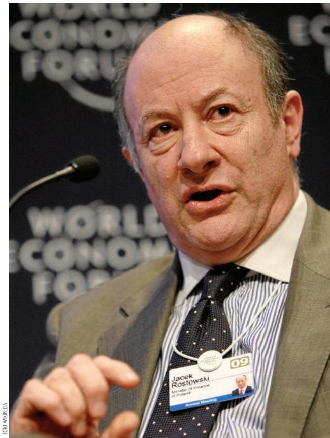
Minister Rostowski zdaje się nie pamiętać o długach sektora rządowego

Olbrzymia dysproporcja między skalą zadłużenia sektora samorządowego i rządowego jest faktem, o którym Jacek Rostowski niechętnie mówi. Prawdą jest jednak to, że lawinowo rośnie dług jednego i drugiego rodzaju. W odniesieniu do samorządów, zwrócić należy uwagę na coraz większe długi polskich miast, które sięgają 28 mld zł, co stanowi niemalże połowę ich dochodów. W czołówce zestawienia są takie miasta jak: Włocławek (81%), Poznań (72%) i Toruń (70%). Górnośląskie miasta pod tym względem wypadają lepiej, choć w przypadku Katowic (ok. 30%) dług wynosi aż czterokrotnie więcej niż przed ośmioma laty. Polityka władarzy miast ustawicznie idzie w stronę zwiększania wydatków kosztem długu, jednak ciągle sporo brakuje nam do europejskich „potentatów” w tym zakresie, jak choćby Berlina, który wydaje średnio trzykrotnie więcej niż posiada. Prezydenci miast mocno oponują przeciwko przygotowywanej przez resort finansów nowej regule wydatkowej, wskazując na inwestycyjny charakter wydatków finansowanych z kredytów. W istocie inwestycje te mają różnoraki charakter – od typowo infrastrukturalnych po takie, które zago-