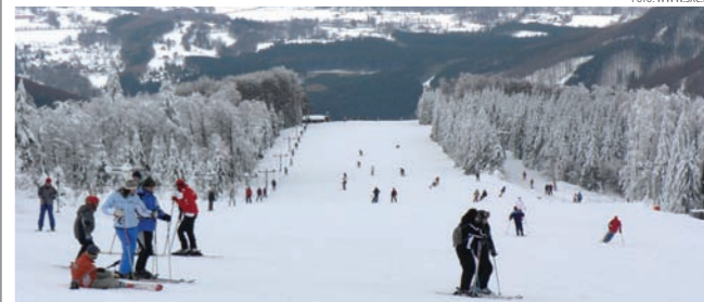
Coraz więcej turystów wypoczywa w naszym województwie

Rośnie liczba turystów w województwie śląskim. W porównaniu z poprzednim rokiem było ich o jedną czwartą więcej – informuje Śląska Organizacja Turystyczna. 4 miliony – tyle osób podróżowało w 2011 r. po województwie śląskim, czyli o ok. milion więcej niż rok wcześniej, w tym 600