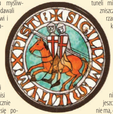
Symbol Zakonu Ubogich Rycerzy Chrystusa i Świątyni Salomona

dziwnym w przypadku Rycerzy Świątyni - na Morawach do dzisiaj po templariuszach zostały wielkie piwnice, w których produkują się słynne templarskie wino. Sama sieć tuneli miała zostać podobno zniszczona w trakcie poszerzenia kanału Odry oraz konstrukcji śluzy na rzece. Jak dotąd nikomu nie udało się odkryć wejścia do tuneli, co wciąż stanowi pozrywkę dla poszukiwaczy tajemnic. Pamiętajmy jednak, że sam fakt nie znalezienia tuneli jeszcze nie oznacza że ich nie ma, czy też nigdy nie było.