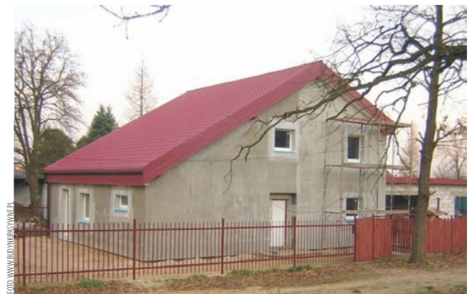
Dom pasywny pozwala aż ośmiokrotnie zmniejszyć zużycie energii

sposób, aby zachodziła wymiana ciepła bez mieszania się samych strumieni. Rekuperatory mają sprawność dochodzącą nawet do 90 proc., co oznacza, że taka ilość ciepła zostaje przekazywana między strumieniami. W okresie niskich temperatur konieczne jest dogrzewanie powietrza nawiewanego. Bardzo ważne jest zapewnienie szczelności w powłoce zewnętrznej budynku. Dlatego jest przeprowadzane badanie szczelności przy pomocy próby ciśnieniowej. Polega ona na