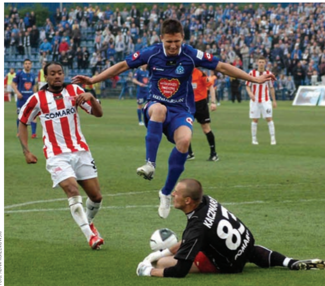
Blisko ćwierć wieku temu Ruch Chorzów był najlepszy w Polsce. Czy niebawem o górnośląskich klubach znów będzie głośno?

Gdy w 2007 r. do Górnika wchodził potężny inwestor – niemiecki Allianz – mało kto wątpił, że do Zabrza wrócą tłuste lata. A jednak stała się rzecz niespotykana – Górnik zamiast walczyć o najwyższe miejsca, spadł z ligi. Ruch w tym czasie podnosił się powoli z okresu swojej najdłuższej nieobecności na najwyższym szczeblu rozgrywek. Choć za Niebieskimi nie stał tak potężny sponsor, to jednak wydawało się, że spokojna praca „u podstaw” przyniesie efekty. Tym bardziej, że raz po raz w mediach pojawiały się informacje, że Ruch jest już bardzo blisko pozyskania możnego sponsora.