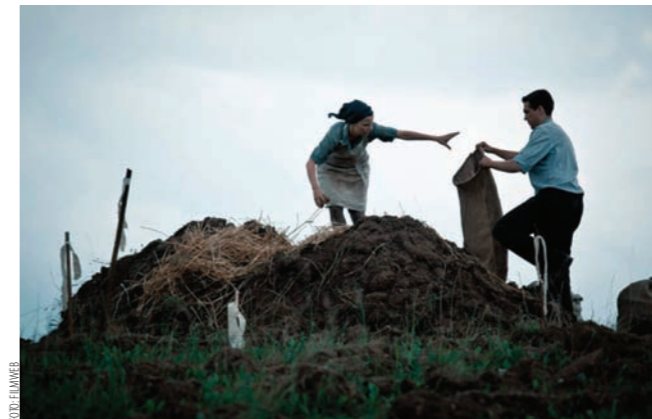
Kadr z filmu „Róża” Wojciecha Smarzowskiego

bezkrytycznie podchodzi do dylematów tożsamościowych mniejszości etnicznych, które po 1945 r. znalazły się w granicach państwa polskiego. Produkcja niejednokrotnie sugestywnie i bardzo brutalnie pokazuje wydarzenia z drugiej połowy lat 40.