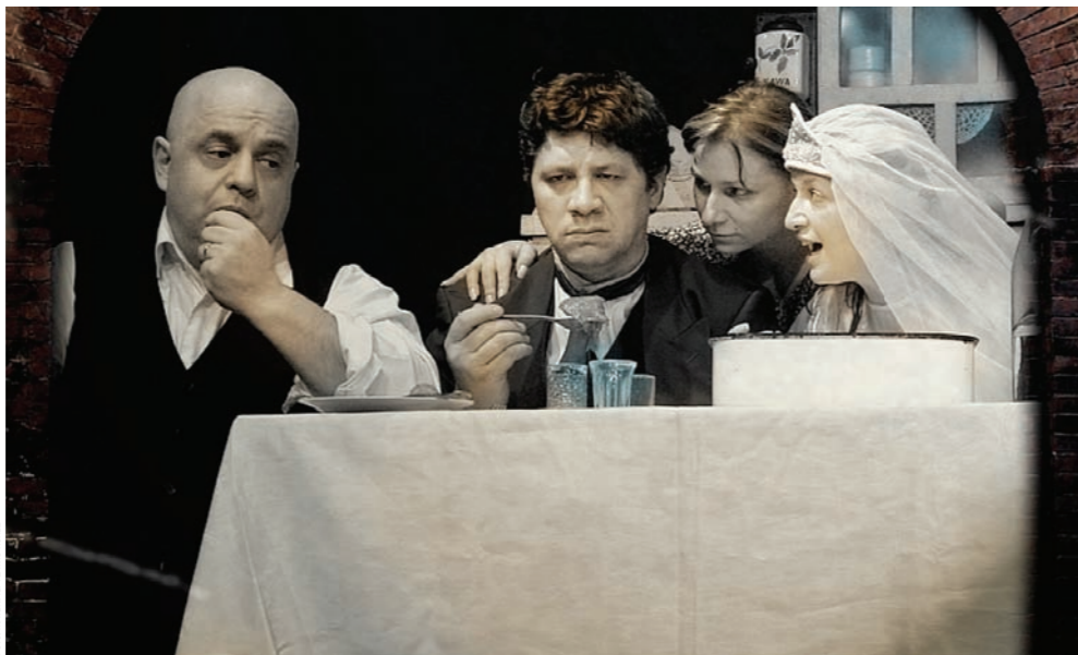
„Cholonek”, chociaż grany już od siedmiu lat, ciągle przyciąga tłumy widzów. Niebawem będziemy mogli zobaczyć go także w TVP Kultura

aktor, reżyser, konferansjer, dyrektor katowickiego Teatru Korez. Laureat Nagrody dla Młodych Twórców oraz nagrody Prezydenta Miasta Katowice. Pomysłodawca i dyrektor Letniego Ogrodu Teatralnego oraz Katowickiego Karnawału Komedii. Poza swoim Korezem występuje m.in.