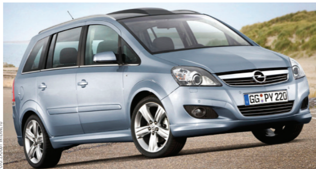
Opel Zafira II to jeden z modeli produkowanych w gliwickiej fabryce

Gliwicka fabryka Opla, to nowa inwestycja – jej zakład wybudowano w 1998 r. Produkowano tu modele Agila, Astra i Zafira, a także bliźniaczy model tej pierwszej – Suzuki Wagon R+. Największą popularność przyniosły jednak modele Astry w serii klasycznej. Gdy na rynkach pojawiały się już kolejne