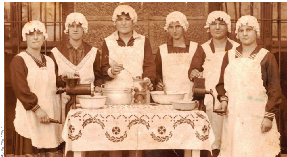
Młode Ślązaczki na kursie gotowania. Kostuchna, okres międzywojenny

Warto jednak zauważyć, że to właśnie w naszym regionie te tradycyjne podziały trzymały się wyjątkowo długo. Nie mówimy tu przy tym o jakiejś bardzo odległej tradycji. Ten schemat postrzegania kobiety i jej roli w społeczeństwie ma bowiem rodowód stosunkowo młody, bo sięgający zaledwie XIX wieku. To właśnie w tym stuleciu powstał w Niemczech slogan „Kinder, Küche, Kirche” mający opisywać specyficzną dla tego okresu pozycję kobiety w społeczeństwie i jego podstawowej komórce, czyli rodzinie. Lewicowi interpretatorzy historii (jak Eric Hobsbawm), łączą ten fakt bezpośrednio z rewolucją przemysłową i towarzyszącymi jej przemianami w społeczeństwach krajów europejskich. To wtedy doszło między innymi do tak wyraźnego rozdziału gospodarstwa domowego od miejsca pracy. Wcześniej stanowiły one pewną całość (rolnik potrzebował przecież swej żony również jako partnera do pracy przy gospodarstwie). Od XIX wieku z punktu widzenia ekonomii liczyć zaczęły się tylko ten, kto „chodził do pracy”, nieważne, czy była to kopalnia, fabryka, czy huta. Konsekwentnie więc tylko mężczyzna zatrudniony w zakładzie był tym, który „naprawdę” pracował. Kobieta została zepchnięta i zamknięta w świecie, którego horyzont wyznaczały obowiązki domowe. Około 1890 roku w Niemczech, w tym również na Śląsku, pracowało