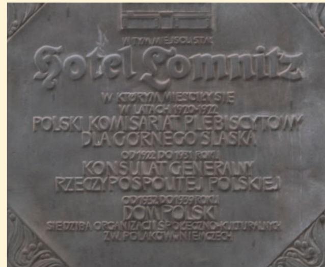
Tabliczka pamiątkowa na budynku dawnego hotelu Lomnitz w Bytomiu, który był siedzibą m. in. komisariatu plebiscytowego