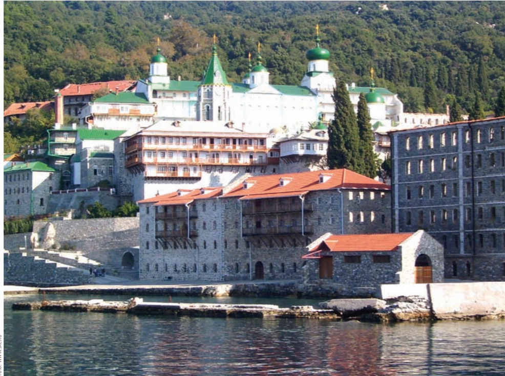
Jeden z klasztorów Autonomicznej Republiki Mnichów

Rząd grecki utrzymuje natomiast na terenie półwyspu swojego gubernatora i wielkie siły policyjne. Konstytucja grecka reguluje status Athosu jako obszaru autonomicznego pod władzą rządu Grecji (jako departamentu – odpowiednika