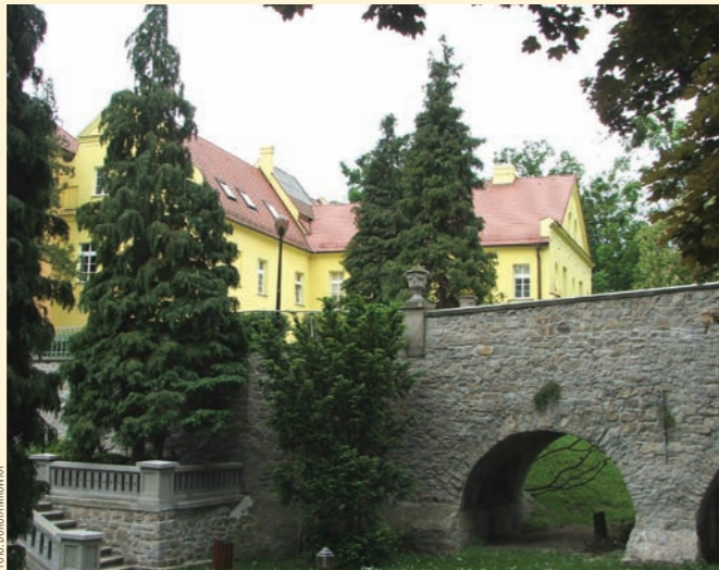
Dzisiaj w zamku w Rogowie Opolskim mieści się filia biblioteki, można tu także zorganizować konferencję lub uroczysty bal

Malowniczo położony zamek w Rogowie Opolskim do dzisiaj przez miejscową ludność jest uważany za dawną siedzibę Templariuszy połączoną tajemniczymi tunelami z zamkami w Otmęcie, Obrowcu i Krapkowicach. Historycy nie dają w to wiary twierdząc, że brak dokumentów w tej kwestii czyni z tych podań jedynie legendę. Zamek ukryty wśród drzew i wznoszący się tuż nad prawym brzegiem Odry robi niezwykle wrażenie. Został zbudowany z kamienia łamanego i cegły, pierwotnie na planie litery „L”. Po dobudowaniu północnego skrzydła „L” zmieniło się w „T”. Dookoła zamku rozciągają się dawne mury oporowe oraz fragmenty fosy. Na murach do dzisiaj widnieje zaznaczenie poziomu wody ze słynnej powodzi w 1997 r. Z zamkowego dziedzińca można zejść po krętych schodach w dół, do małego parku wypełnionego rzeźbami, pawilonami oraz rzadkimi okazami drzew - w tym mitorzębem japońskim.