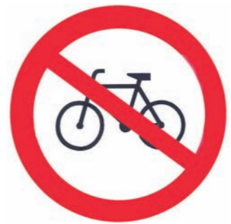
Opolskie autobusy są zamknięte dla rowerów

Jedynie cztery lub pięć osób może przewozić rowery w miejskich autobusach. „Nowa Trybuna Opolska” pisze o zasadach transportu jednośladów przez Miejski Zakład Komunikacyjny. Zapis dotyczący rowerów odnosi się wyłącznie do