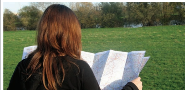
Tradycyjne mapy odchodzą do lamusa. Szczegóły na: www.trakt.wodzislaw.pl

informacje o remontach dróg i utrudnieniach w ruchu. Każdy może pomóc. Wystarczy telefon z GPS i podczas wycieczki można zarejestrować pokonaną trasę. Następnie wystarczy wysłać zapis na adres poczty elektronicznej stowarzyszenia: trakt@trakt.wodzislaw.pl. Mile widziane będą także zdjęcia oglądanych obiektów i zwiedzanych miejsc.