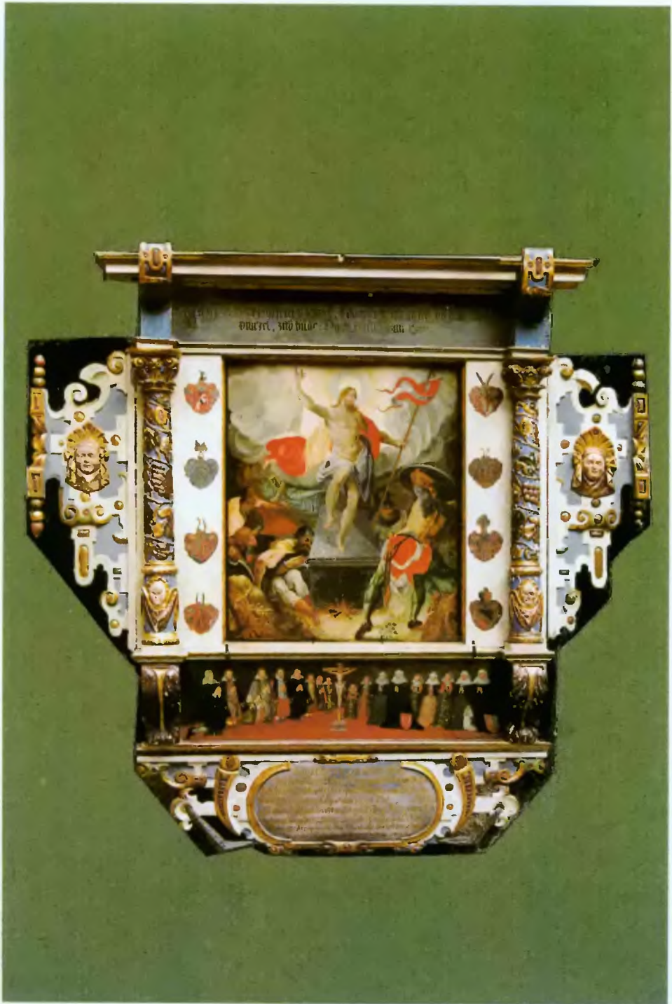
Epitafium Joachima Bludowskiego z Dolnych Bludowic. Ufundowane ok. 1620 r., obecnie w zbiorach Muzeum w Cieszynie.