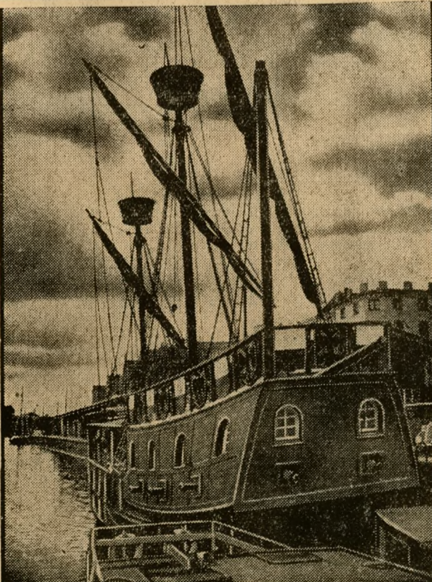
Hansafogge wird Olympisches Feuer tragen.

In der Nacht zum Sonntag fuhr ein Kraftwagen aus Frankfurt a. M. bei der Einfahrt des Mainauer Zollhäufens in den Rhein. Die Insassen, ein Mann und eine Frau, sind ertrunken.