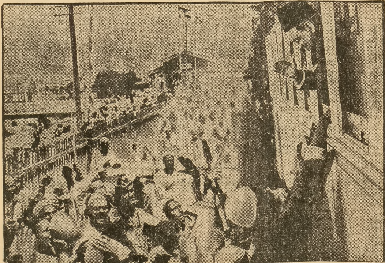
Ägyptens Bevölkerung dankt dem heimkehrenden Ministerpräsidenten Nahas Pascha.

an der Hauptstraße und Straße gelegen, sofort zu vermieten. Zabka , Ober-Lazisk