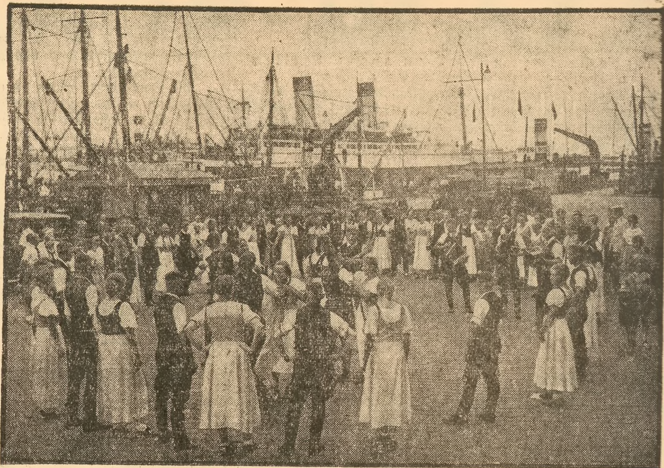
Tanz im Hamburger Hafen.

in großer Auswahl Kattowitzer Buchdruckerei und Verlags-Spółka Akc.