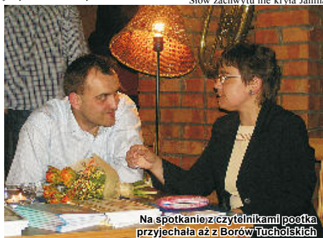
Na spotkaniu z czytelnikami poetka przyjechała aż z Borów Tucholskich

się skrawek zieleni ze stokrotkami. Podobny widok zastałam w Knurowie, zieleń i miliardy stokrotek, i nie tylko ja byłam nim zachwycona.