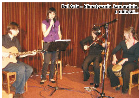
Del Arte – klimatycznie, kameralnie, o miłości...