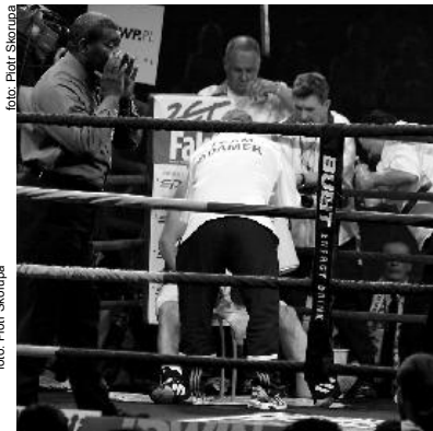
Narożnik „Górala”, a w nim trener z Knurowa

Adamek znowu pokazał naszą, polską szkołę boksu