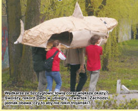
Wędkarze ze Szczygłowic łowią coraz większe okazy? Swoisty rekord padł w ubiegły czwartek. Zachodzi jednak obawa, czy to aby nie rekin trojański?