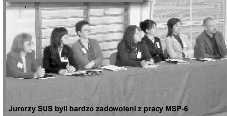
Jury SUS byli bardzo zadowoleni z pracy MSP-6

Górnych, Zabrze, Radostowicach, Rybniku-Ochojcu, Zorach, brała udział w konferencji regionalnej w Świętochłowicach, a także spotkaniach Sieci Szkół w Piotrowcu, Warszawie, Knurowie i Zabrze oraz w szkoleniach.