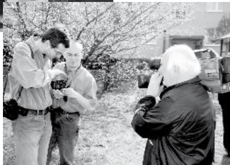
Plenerowe ujęcia do programu „Z życia Kościoła”