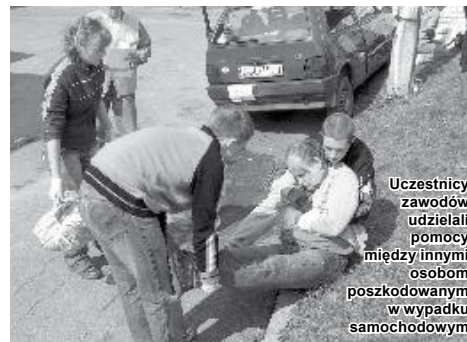
Uczestnicy zawodów udzielali pomocy między innymi osobom poszkodowanym w wypadku samochodowym