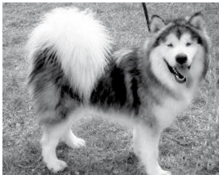
Łagodny wygląd zwierzęcia może wprowadzać w błąd

Pies rasy alaskan malamut pogryzł dwie knurowianki. Jedna z nich została pogryziona w lewe przedramię, a druga ma uraz głowy nad lewym okiem, uszkodzony bark i pogryzione dłonie. Zwierzę mieszkało ze swoimi ofiarami zaledwie dwa dni