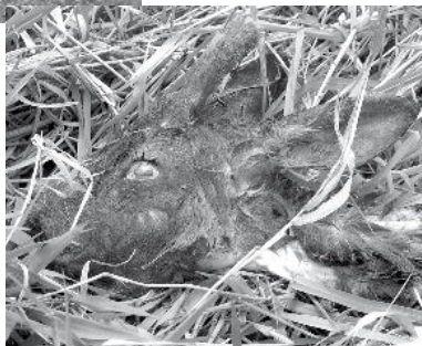
Głowę z różkami (parostkami) i skórę kozła sarny kłusownik porzucił w rzece