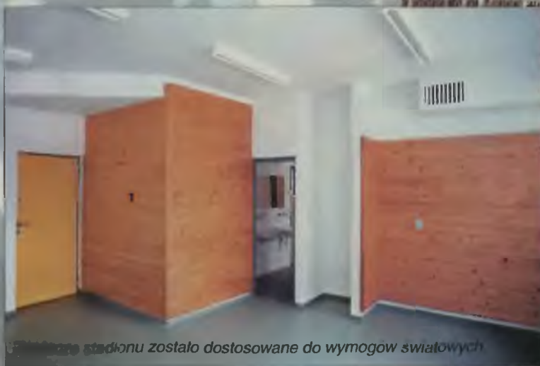
Wnętrze stadionu zostało dostosowane do wymogów światowych