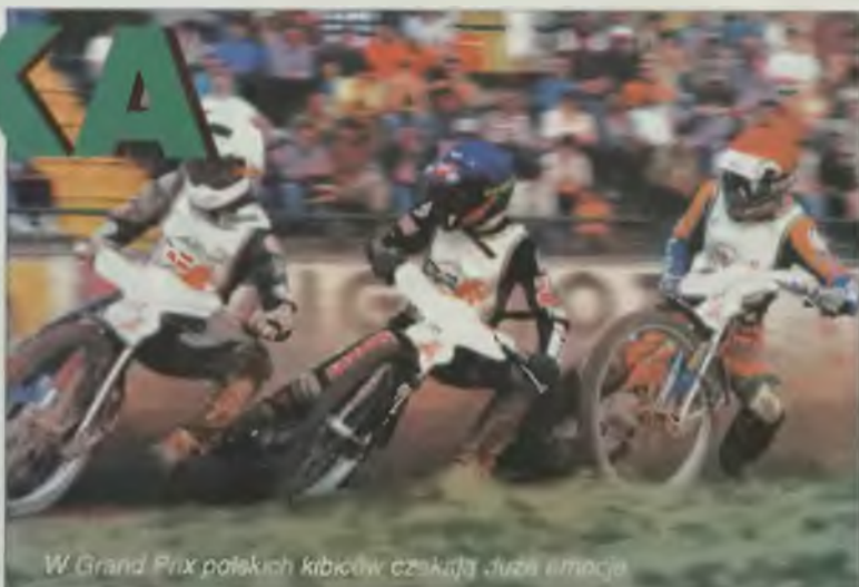
W Grand Prix polskich kibiców czekała już emocja

Już nikt nie ma chyba wątpliwości, że nasz kraj jest żuźlową potęgą. Świadczą o tym nie tylko wyniki uzyskane przez naszych reprezentantów na międzynarodowej arenie, ale również to, że w naszym kraju ścigają się najlepsi zawodnicy. Kilku z nich nawet zrezygnowało ze startów w Anglii decydując się na występy przed pełnymi trybunami w Polsce. Mecze ligowe, okazjonalne turnieje, nie wspominając już o zawodach rangi mistrzostw świata, ściągają na widowieństwo tłumy i tego nam właśnie wszyscy zazdroszczą.