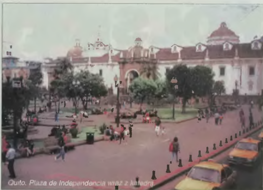
Quito. Plaza de Independencia wraz z katedrą