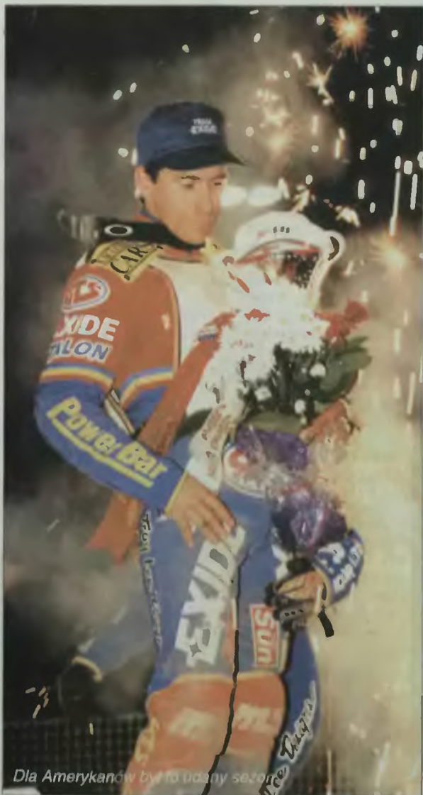
Dla Amerykanów był to udany sezon