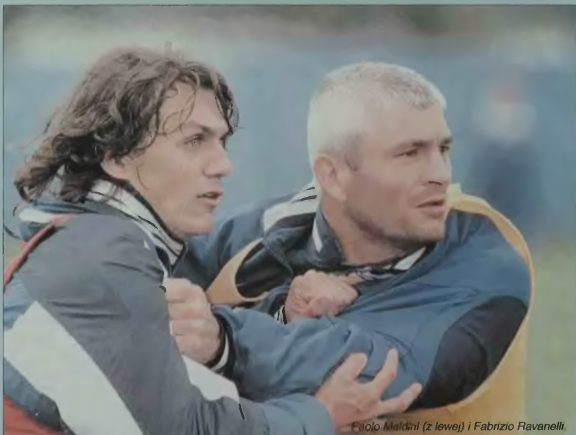
Paolo Maldini (z lewej) i Fabrizio Ravanelli.

Piero – stał się GIANFRANCO ZOLA, strzelec zwycięskiej bramki w meczu z Anglią na Wembley. 31-letni wychowanek Corradi Oliena w 1989 r. trafił do Napoli, gdzie z czasem przejął boiskowe funkcje, pełnione wcześniej przez samego Diego Maradonę. W 1993 r. Zola przeniósł się do Parmy i w jej barwach mógł fetować m.in. zdobycie Superpucharu Europy (93) oraz Pucharu