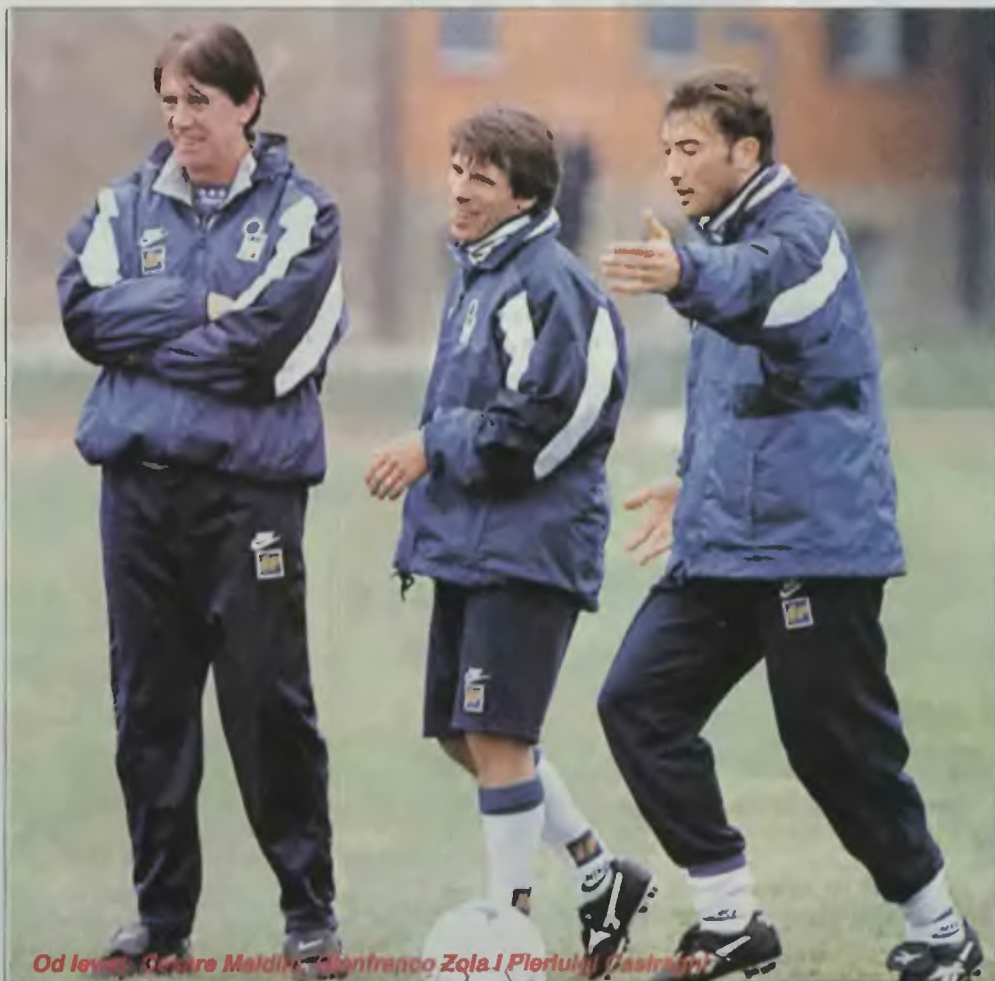
Od lewej: Cesare Maldini, Gianfranco Zola i Pierluigi Casiraghi

Po klęsce na EURO '96 trener pierwszej reprezentacji Arrigo Sacchi był zewsząd krytykowa- ny, nie przekonały nikogo rów- nież jesienne występy drużyny. Losy selekcjonera wydawały się przesądzone, a wśród jego na- stępców najczęściej wymienia-