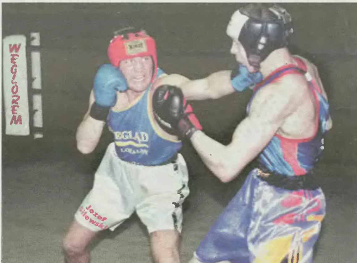
Po przerwie w lidze bokserskiej najciekawiej zapowiada się pojedynek Walki z Kleofasem.