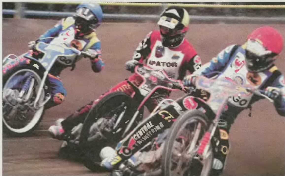
Żuźlowcy rozegrają przedostatnią kolejkę, a potem już play-off.

● GKM Grudziądz - Start Gniezno (Marek Wojczek)