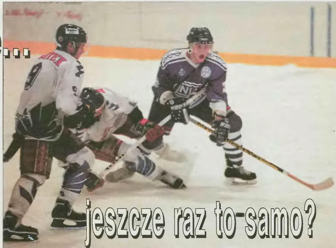
Poprzedni sezon zakończył się sukcesem hokeistów Unii Oświęcim.

Nowotarżanie tymczasem sięgnęli po nowy zaciąg, nie tylko zresztą na Wschodzie. W Nowym Targu zjawili się w tym roku także Finowie, którzy jednak na początek zostali wypożyczeni do SMS I Sosnowiec. Najgroźniejszymi rywalami Unii i Podhala powinny być zespoły STS Autosan Sanok, KTH Opti-