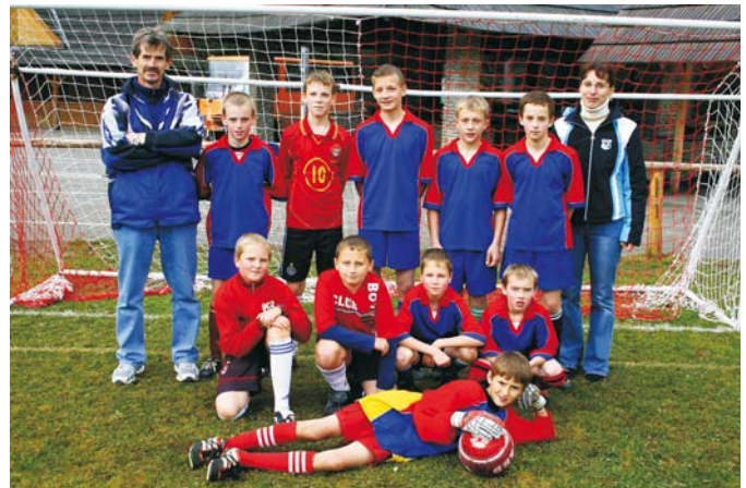
Zwycięska drużyna z SP 1 Koniaków z opiekunami.