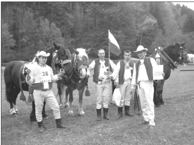
Ekipa z Istebnego