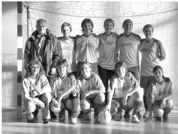
„Drużyna Mitech Żywiec”