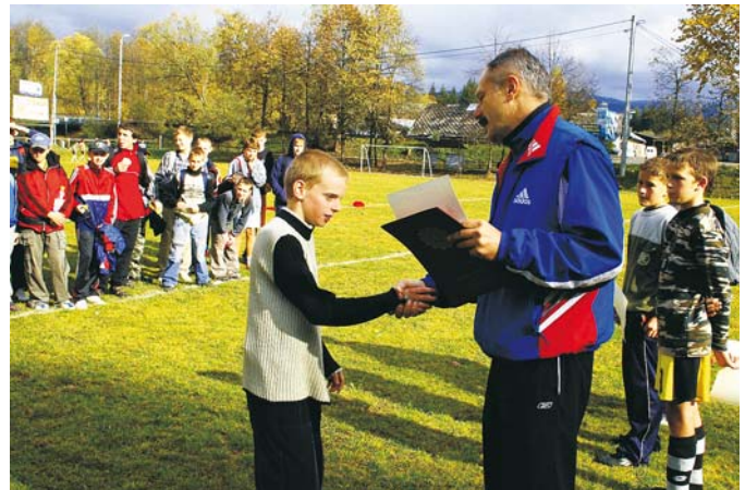
Wręczenie dyplomu dla najlepszej drużyny kapitanowi SP 1 Koniaków