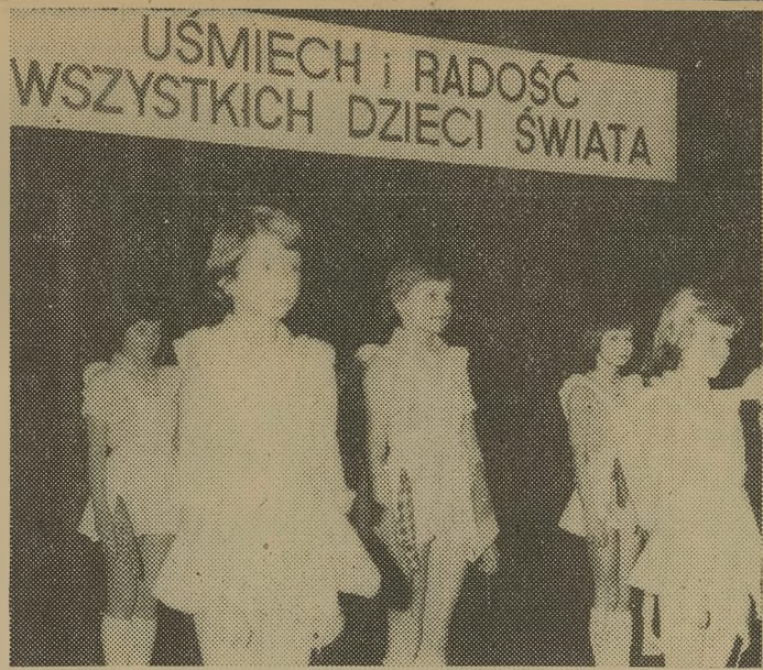
Na estradzie najmłodzi prezentowali swoje umiejętności artystyczne.