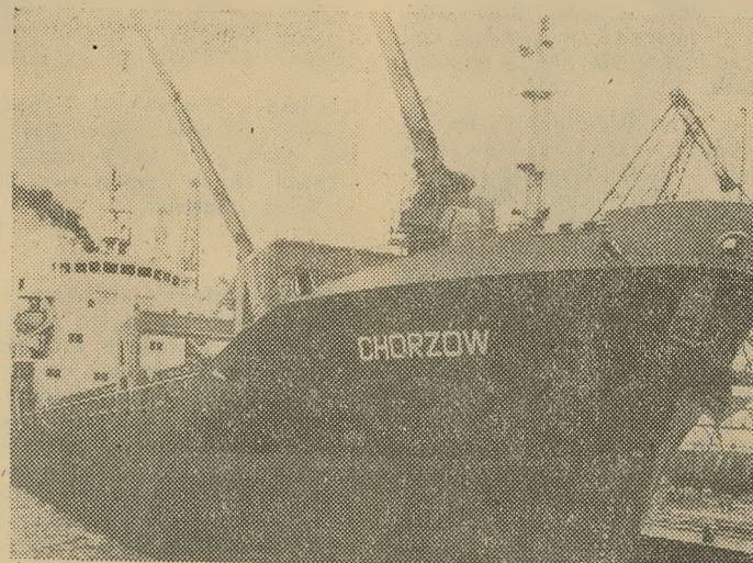
Statek M/S „Chorzów” podczas postoju na nabrzeżu katowickim w Szczecinie.

Najpierw nadeszła wiadomość z angielskiego miasta Glasgow, iż 19 stycznia 1980 roku tamtejszą stocznice opuścił nowy masowiec Polskiej Żeglugi Morskiej — M/S „Chorzów”, wybudowany w ramach polsko-angielskiej spółki żeglugowej. Jego trasa wiodła do francuskiego portu Rouen. Dodajmy, iż M/S „Chorzów” jest szóstym statkiem z serii 15 podobnych, które w br. zasilą flotę PZM, posiada nośność 4.400 ton i jest przystosowany do przewożenia suchych ładunków masowych: węgla, rudy oraz... zboża. Zgodnie z planami PZM statek będzie pływ-