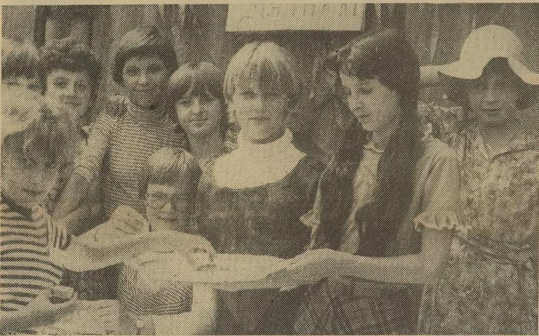
Co roku ponad 22 tys. rudzkiej dzieciarni bierze udział w letniej akcji wypoczynkowej. Na zdjęciu: półkolonia dziecięca w Rudzie Śl.