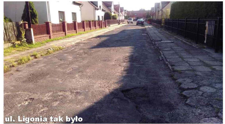
ul. Ligonia tak było

W dniu 25 października br. dokonano komisyjnego odbioru robót polegających na przebudowie ul. Ligonia w Zawadzkiem. W ramach przebudowy ulica uzyskała nową nawierzchnię jezdni i chodników wykonaną z kostki betonowej. Ponadto wymienione zostały lampy oświetlające ulicę na lampy w technologii LED. Wykonawcą robót był Zakład Produkcyjno-Usługowo-Handlowy „BET-BRUK” Zbigniew Bryś z Lublińca. Całkowity koszt robót budowlanych wyniósł 299.863,14 zł.