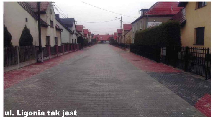
ul. Ligonia tak jest