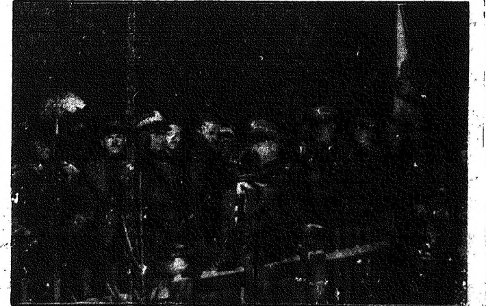
Hold t. baterom r. 1863. Jednym z punktów programu obchodu, urządzanego w Warszawie w 70-tą rocznicę powstania styczniowego, było złożenie holdu poległym i zmarłym powstańcom. W czasie manifestacji w Cytadeli prezes komitetu wykonawczego obchodu 70-lecia powstania gen. Rydz-Śmigły udekorował Krzyżem Traugutta Krzyżem Niepodległości z Mieczami, nadanym poległym i zmarłym powstańcom. Na zdjęciu naszym widzimy gen. Rydz-Śmigłego salutującego Krzyżem Traugutta po udekorowaniu go Krzyżem Niepodległości.

eksport zboża i ażeby zapewniono zbyt polskiemu eksportowi rolnemu. Mówca zapytuje, dlaczego w Polsce zagraniczne jabłka, dlaczego sprowadza się cebulę i pomidory, a nawet żyto? Czy dlatego, że musimy wywozić węgiel? Co za polityka gospodarcza? Czy chłop w Polsce zamknął choćby jeden warsztat polski? To, że rolnictwo pracuje, że są tani płody rolne, to jest szansa rządu, to jest droga do przezwyciężenia kryzysu. Jest