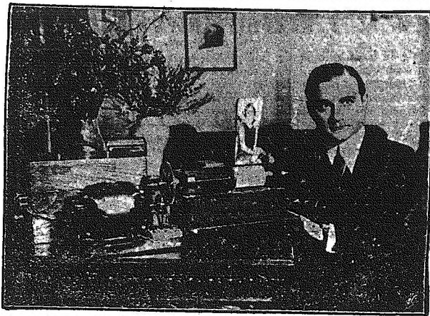
Obrazki z powietrza. Przesyłanie napowietrzną drogą przy pomocy fal elektrycznych wszelkiego rodzaju obrazków, fotografii i t. d. jest już od dłuższego czasu praktykowane zwłaszcza na zachodzie. — Oto widzimy na ilustracji cały aparat, potrzebny do odbioru obrazków ze świata u siebie w domu.

Neubauer smarł dopiero w tych dniach po jedenastu latach od chwili operacji i