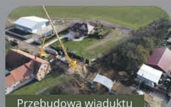
Przebudowa wiaduktu w Karłowicach Małych

Łącznie w okresie 2 lat pracy Zarządu Powiatu pozyskano z funduszy zewnętrznych 97 752 925 zł.