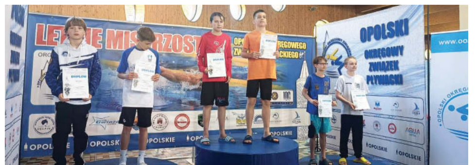
Najlepsi na medalowym podium