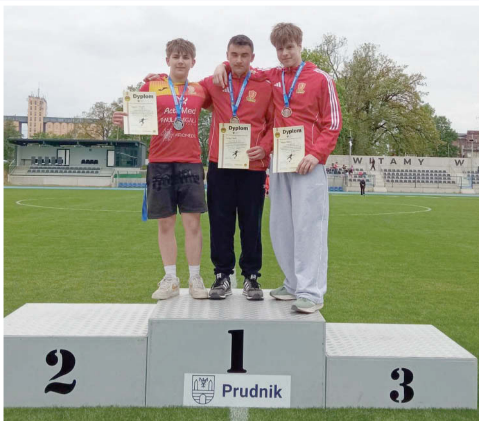
Dla takich chwil warto wylewać hektolitry potu na treningach