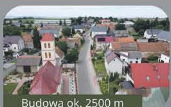
Budowa ok. 2500 m chodników