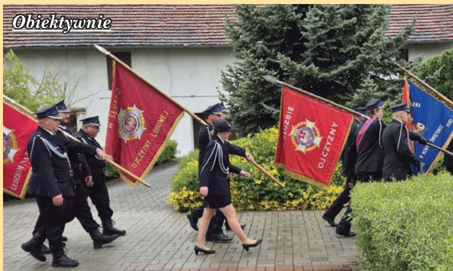
Obiektywnie OSP Lipniki ze sztandarem z napisem „w służbie ojczyzny ludowej”. Polska Rzeczpospolita Ludowa formalnie przestała istnieć w 1989 r. Sztandar już dawno powinien trafić na śmietnik historii. Ciekawe czy chociaż orzeł ma koronę?

Radosław Fogiel (PiS) do Piotra Zgorzelskiego (PSL)