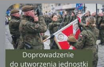
Doprowadzenie do utworzenia jednostki WOT w Nysie