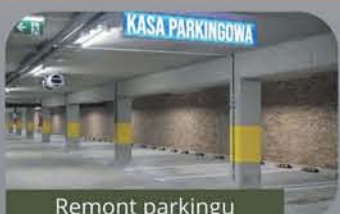
Remont parkingu podziemnego w Nysie