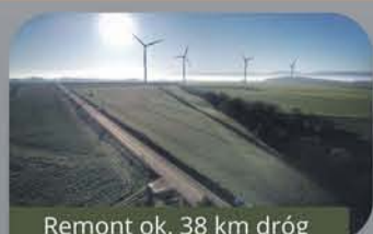
Remont ok. 38 km dróg powiatowych