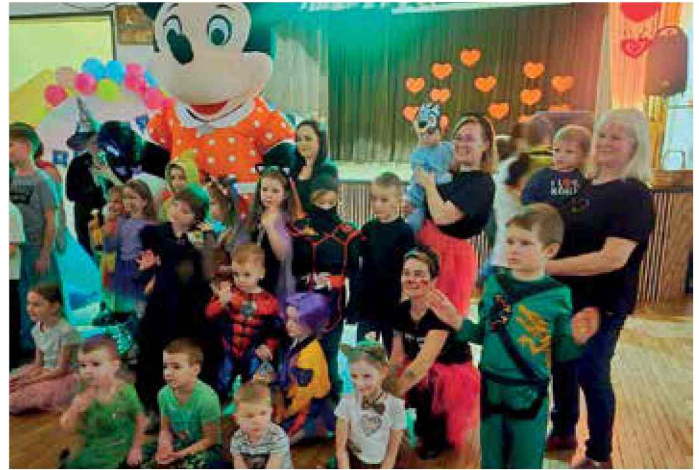
DK Dziergowice - Mały Basik