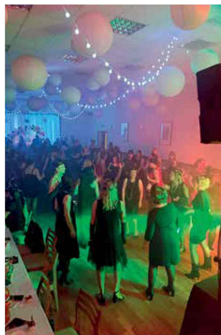
Babski comber w DK Stara Kuźnia