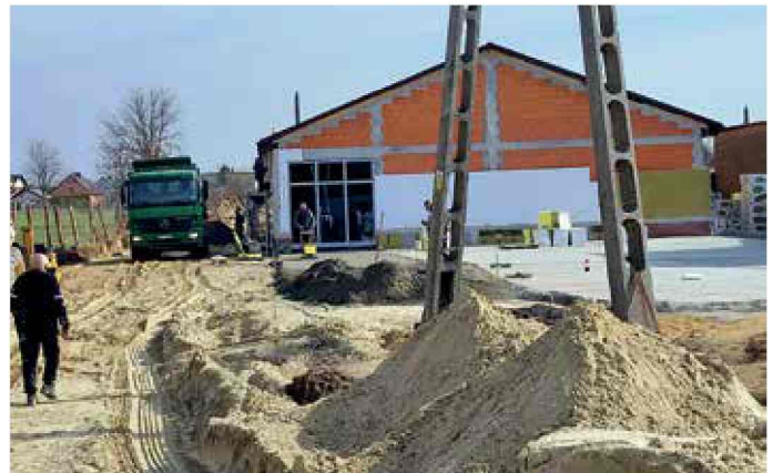
Dziergowice - budowa sklepu