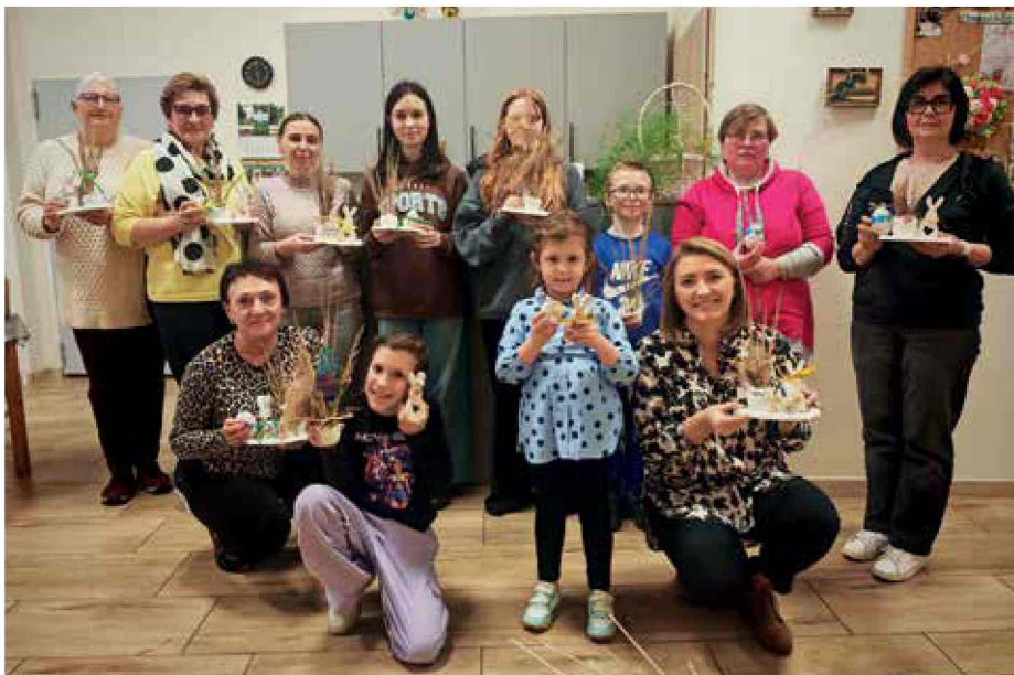
Warsztaty wielkanocne z GCKiR w Bierawie