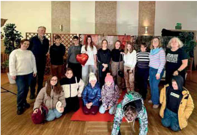
Warsztaty fotograficzne podczas ferii zimowych w DK Dziergowice