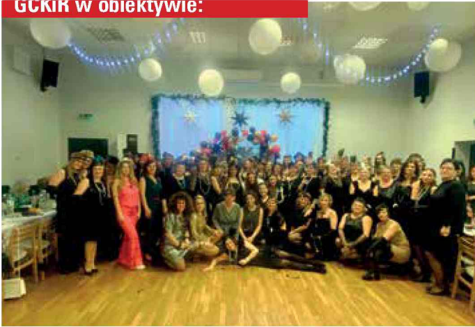
Babski comber w DK Stara Kuźnia