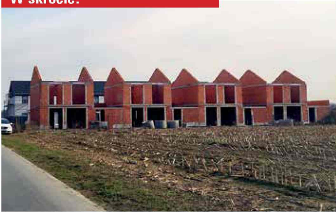
Bierawa - budowa nowych mieszkań