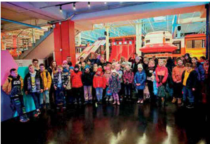
Wycieczka podczas ferii zimowych do Fly Park w Radlinie