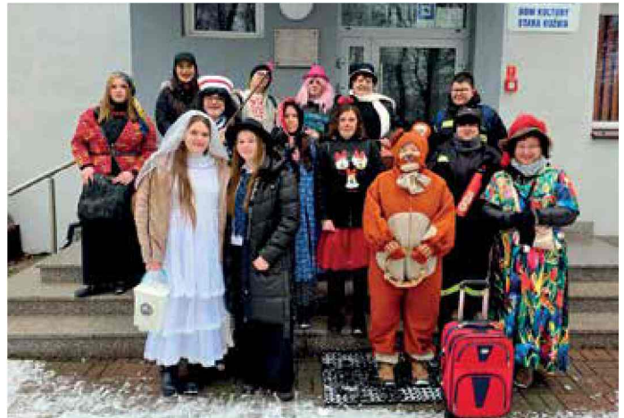
DK Stara Kuźnia - Wodzenie Niedźwiedzia