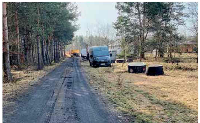
Ortowice - wykonanie kanalizacji, ul. Bukowa