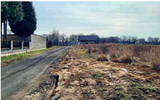
Bierawa - wykonanie kanalizacji, odnoga ulicy Dworcowej