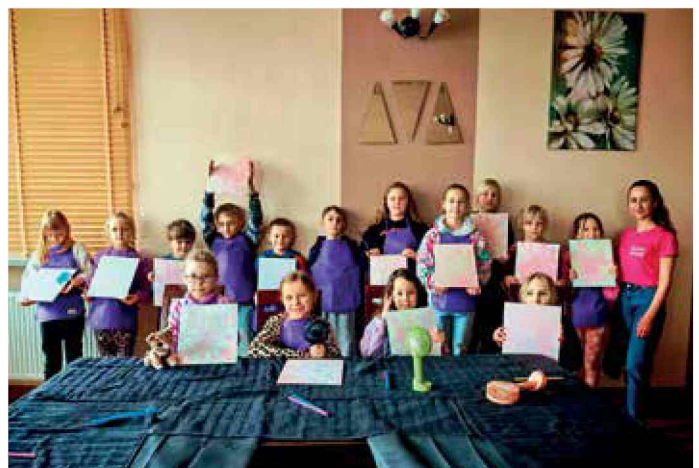
Zajęcia z bańkami podczas ferii zimowych w DK Bierawa