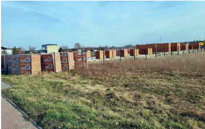
Stare Koźle - budowa nowych mieszkań