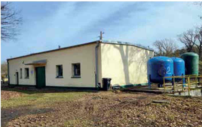
Korzonek - modernizacja Stacji Uzdatniania Wody