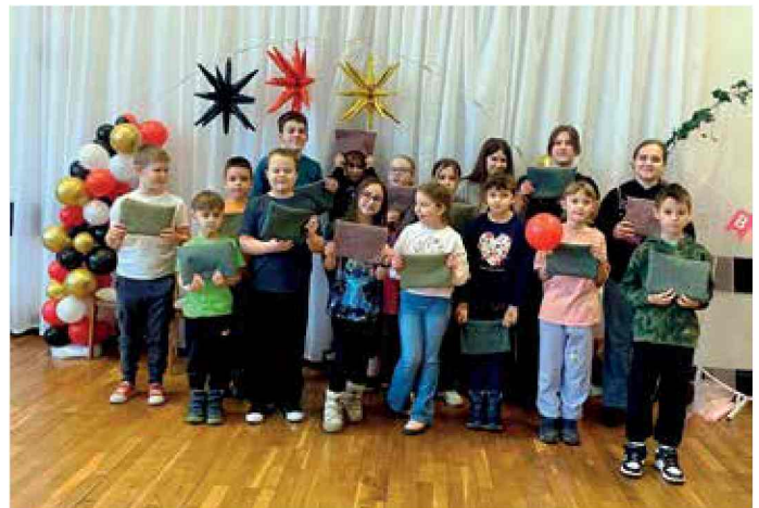
Zajęcia kreatywne podczas ferii zimowych w DK Stara Kuźnia