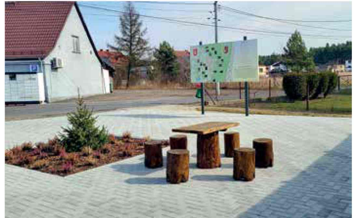
Solarnia - skwerek