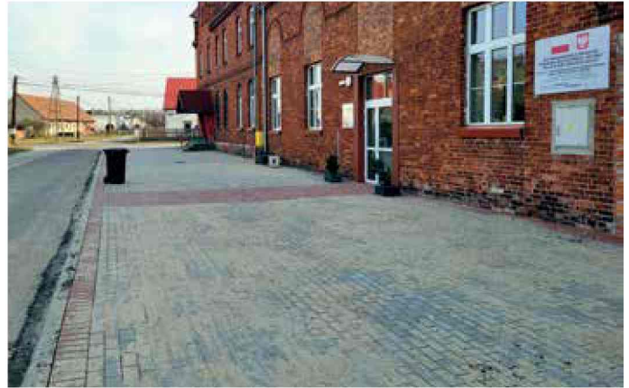
Brzeźce - wybrukowanie placu