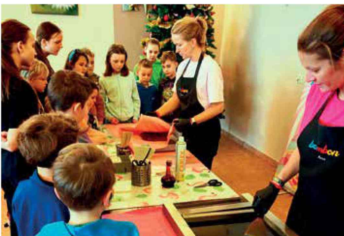
Zajęcia podczas ferii zimowych