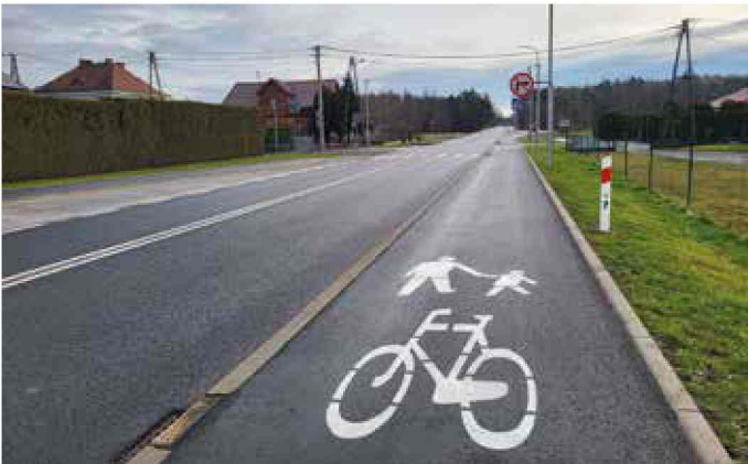
Brzeźce - przebudowa drogi wojewódzkiej 408