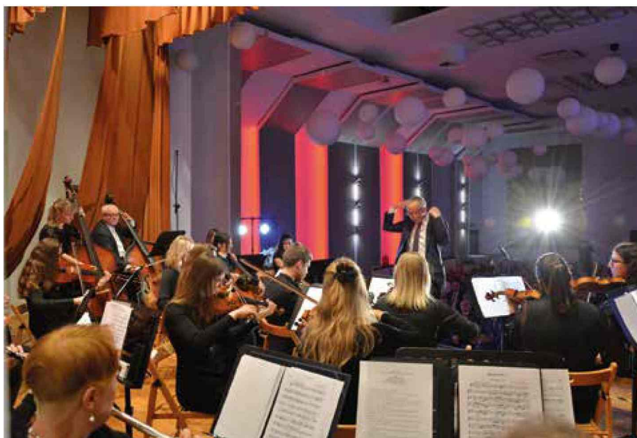
Koncert z okazji Święta Niepodległości w Domu Kultury w Bierawie