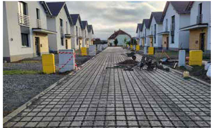
Bierawa - budowa drogi dojazdowej do posesji