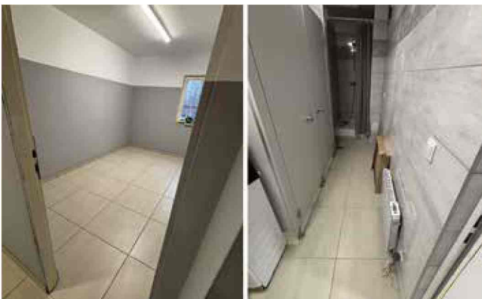
Stara Kuźnia - remont szatni LZS