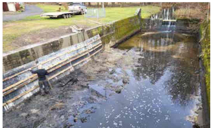
Stara Kuźnia - prace konserwacyjne na rzece Łączka