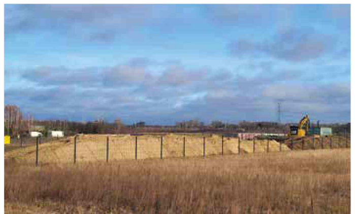
Stare Koźle - rozwój budownictwa w gminie