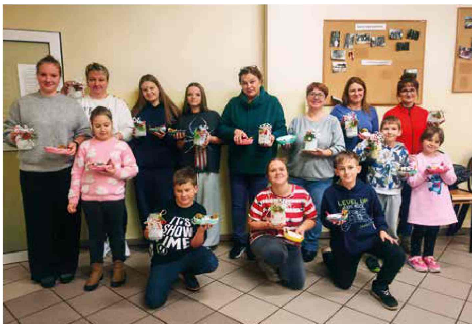
Warsztaty z GCKiR w Bierawie - Świetlica w Kotlarni