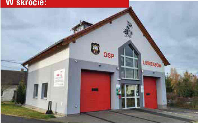
Lubieszów - zmodernizowana remiza