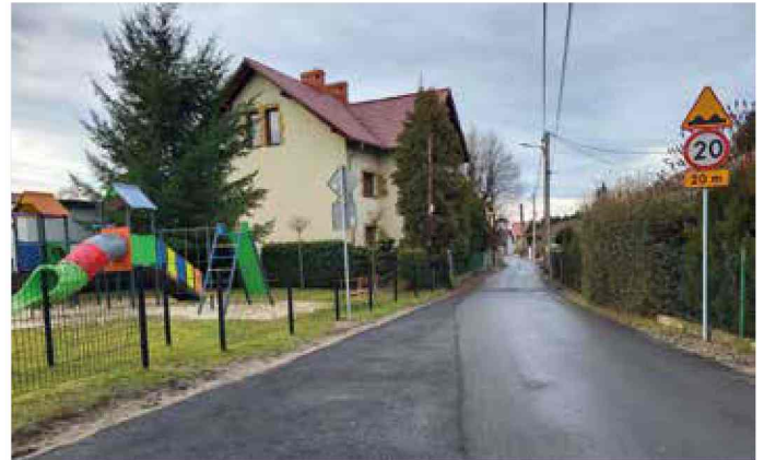
Solarnia - nowa nawierzchnia ulicy Powstańców