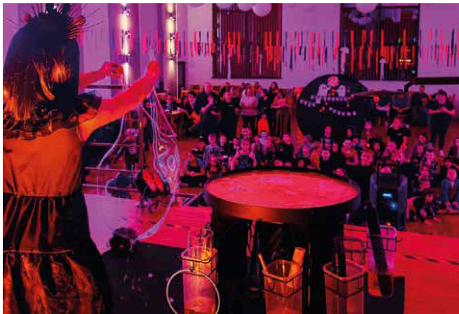
Strasznie fajny bal - Dom Kultury w Bierawie