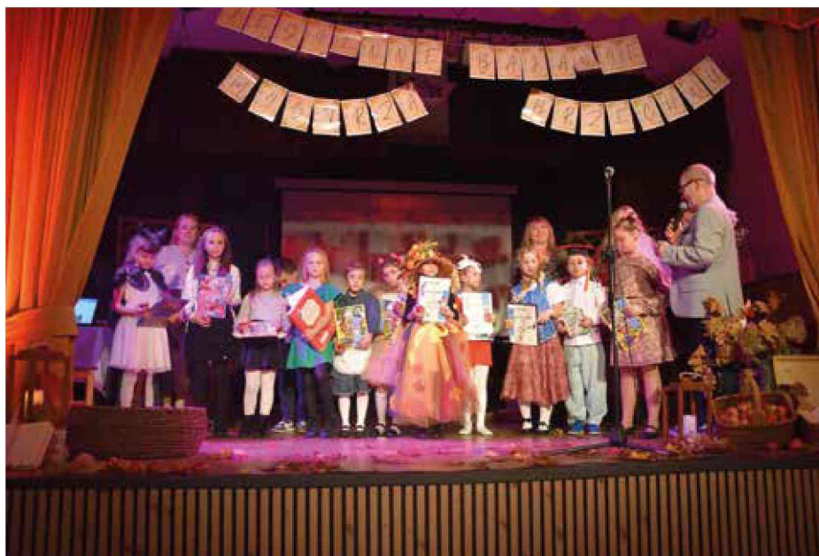
Jesienne Bajanie Mistrza Brzechwy