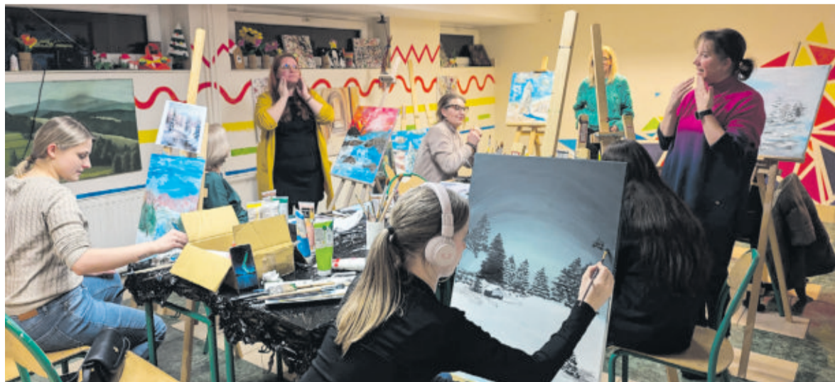
Malarskie warsztaty udanie łączyły przyjemne z pożytecznym