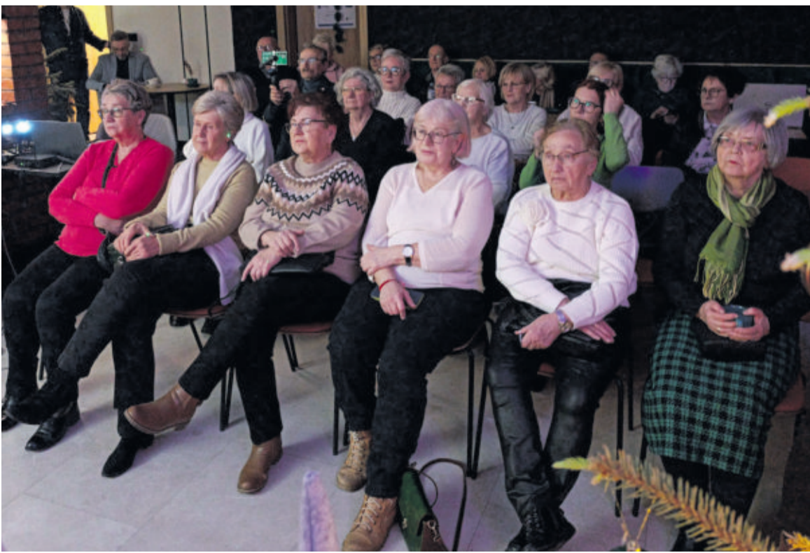
Knurowscy zacy UTW z uwagą wysłuchali fascynujących opowieści