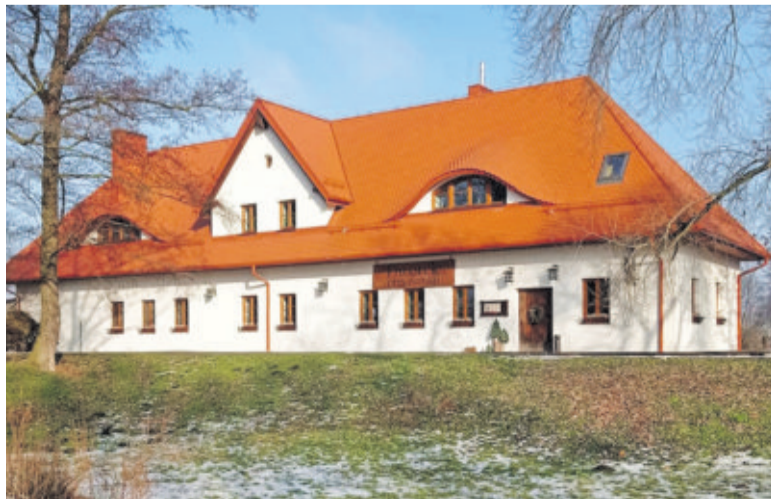
„Dworek przy Zamku”