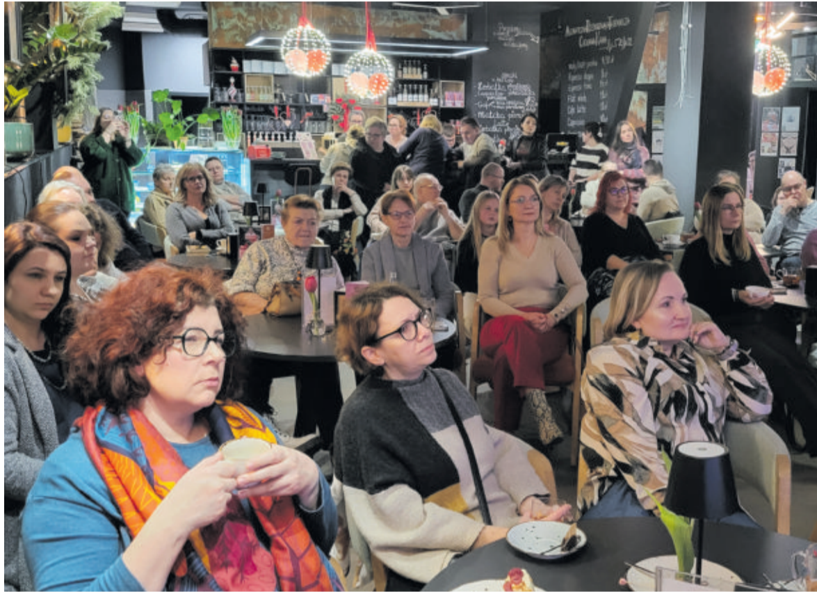
Poczytny autor i podejmowane przezeń tematy spotkały się z dużym zainteresowaniem czytelników