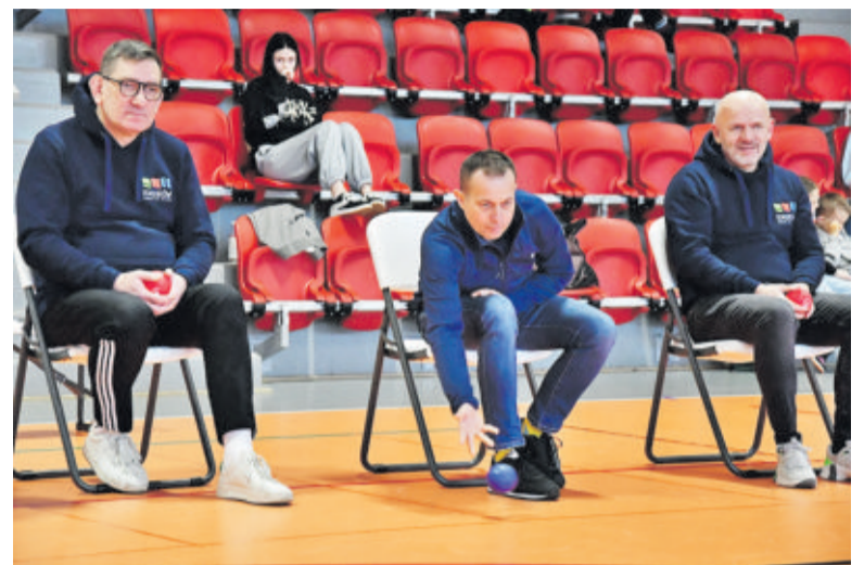
Boccia to gra dla każdego, a jednym z jej walorów jest integracja

dzowie 7:3, Dyrektorzy – Sponsorzy 6:5, Reszta Świata – Dyrektorzy 4:3, Partnerzy – Sponsorzy 7:4, Sportowcy – Wodzowie 6:5, Partnerzy – Dyrektorzy 6:8, Wodzowie – Sponsorzy 6:9, Partnerzy – Reszta Świata 6:7, Reszta Świata – Sportowcy 6:3, Wodzowie – Dyrektorzy 6:1, Partnerzy – Sportowcy 7:7