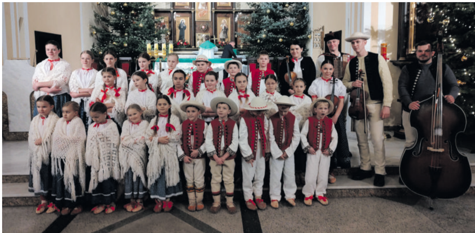
Zespół „Mała Istebna” skradł serca publiczności

Głównym organizatorem był Chór „Cecylia”. Wsparli go prywatni sponsorzy z Paniówek, miejscowe organizacje oraz Gmina i GOK w Gierałtówicach. jm, fot. Jerzy Miszczyk