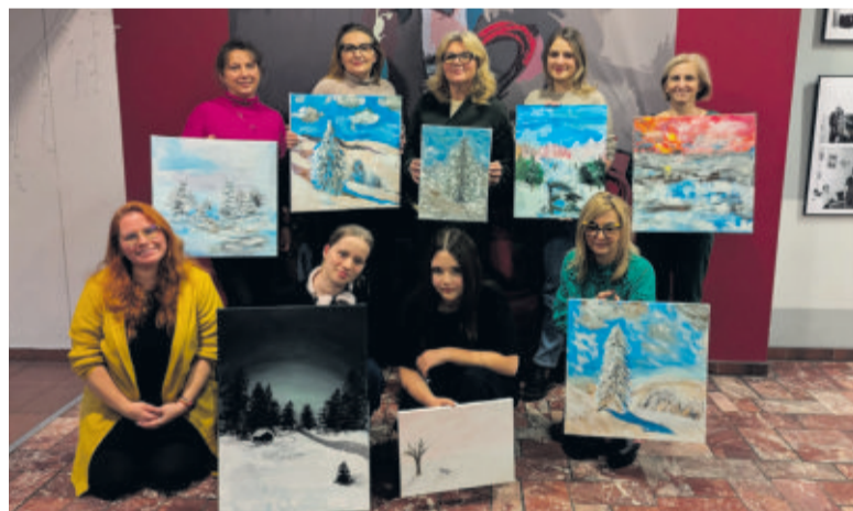
Stres „się stracił”, pozostały piękne obrazy