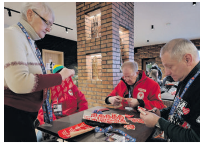
Wśród wolontariuszy nie mogło zabraknąć krwiodawców z Klubu HDK im. dra F. Ogana