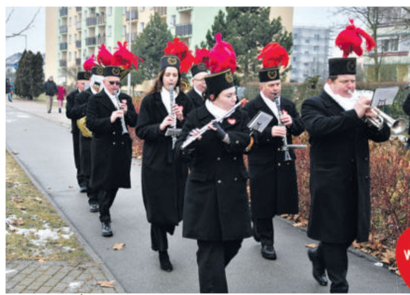
34. Finał WOŚP nie mógł się obyć bez górniczej orkiestry