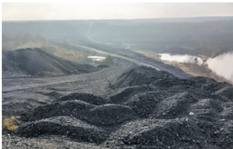
Część wyścigu odbędzie się na terenie Centralnego Składowiska Odpadów Górniczych