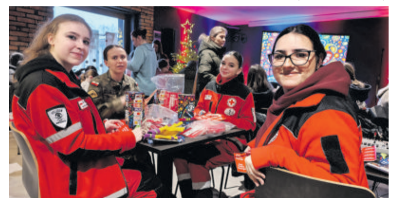
Młodzież z zapałem podeszła do kwestowania