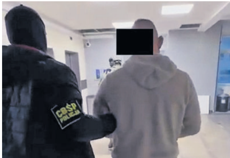
W listopadzie 2024 roku CBSP zatrzymało trzech mężczyzn podejrzanych o zabójstwo z 2005 roku

Na piętrze domu nocowało wujostwo. Wyrwane ze snu i ster-