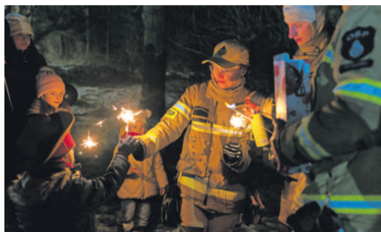
Światło do nieba w formie zimnych ogni

wowano rozgrzewający żur, pyszną kiełbasę z grilla oraz domowe ciasta przygotowane nie tylko przez wolontariuszy, ale także przez panie wójt. Dodatkowymi atrakcjami były fotobudka oraz mini ZOO. Cały dochód z imprezy zasilił konto WOŚP.