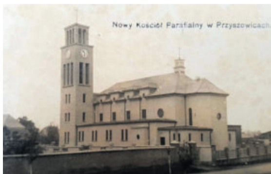
Kościół od strony wschodniej i południowej