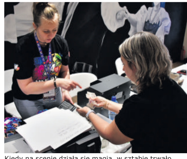
Kiedy na scenie działa się magia, w sztabie trwało liczenie datków