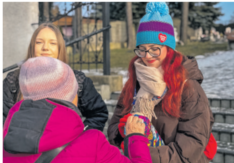
W gminie Pilchowice z puszkami kwestowało 25 osób

Wydarzenia pod szyldem WOŚP odbywały się w różnych miejscach na terenie gminy – w Domu Kultury w Wilczy, w klubie w Nieborowicach, czy w sali przy ul. Damrota 5 w Pilchowicach. W ich organizację włączyły się rady sołeckie, szkoły z radami rodziców, koła gospodyń wiejskich, biblioteka, lokalne firmy, organizacje, jednostki OSP.