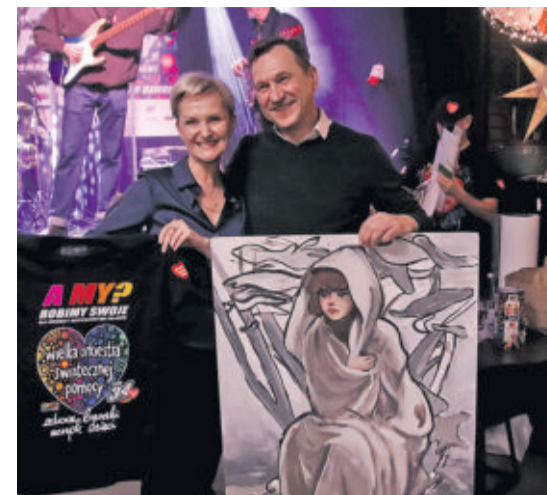
Licytując, darczyńcy wspierali orkiestrowe dzieło