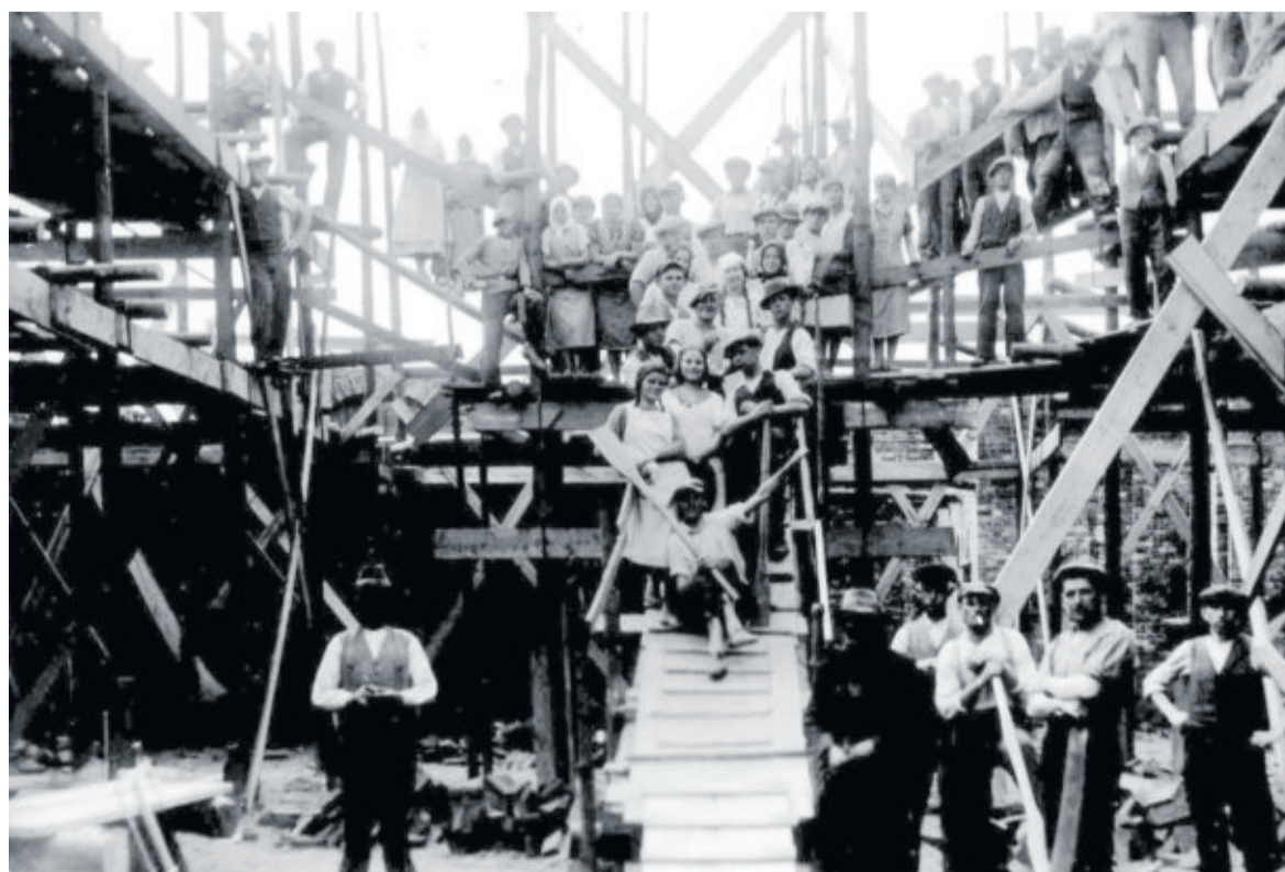
Zdjęcie z budowy nowego kościoła

Krystyna Augustyniak