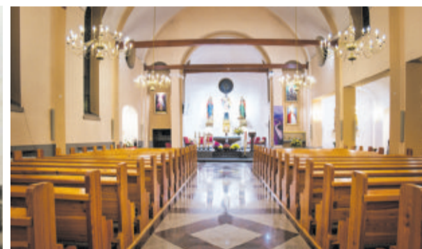
Wnętrze świątyni - wygląd obecny, po remoncie w ramach szkód górniczych, wykonanym w 2013 roku

Gwałtowny rozwój przemysłu na Śląsku, jaki nastąpił na przełomie XIX/XX w., spowodował migrację ludności. W okolicznych miejscowościach zauważalny był szybki przyrost liczby mieszkańców. W Przyszowicach odnotowaliśmy w tym czasie dużo przybyszów z okolic Żor, ale także z terenów dziś zwanych Śląskiem opolskim, a nawet zza granicy, czyli Śląska cieszyńskiego, jak również z „Polski rosyjskiej”. Podobnie pewnie było we wszystkich sąsiednich miejscowościach.