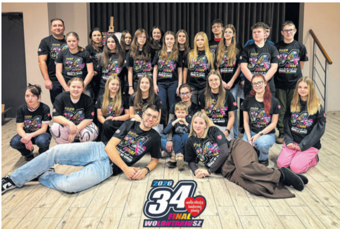
Wolontariusze pilchowickiego sztabu WOŚP mieli pełne ręce roboty, ale znaleźli chwilę na pamiątkowe zdjęcie

brzu czy na koncert do zabrzańskie filharmonii, świąteczne stroiki z lokalnej kwiaciarni, rodzinną przejażdżkę bryczką, sesję zdjęciową z końmi, zabawki, rękodzieło.