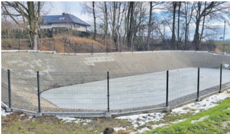
Zbiornik retencyjny z nowo wybudowanym systemem kanalizacji deszczowej zapewni skuteczne odwodnienie tej części miasta