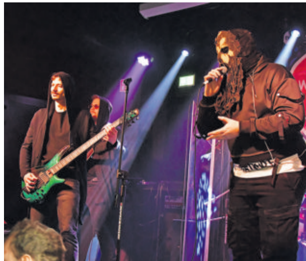
Zespół Vuuk dał rockowego czadu