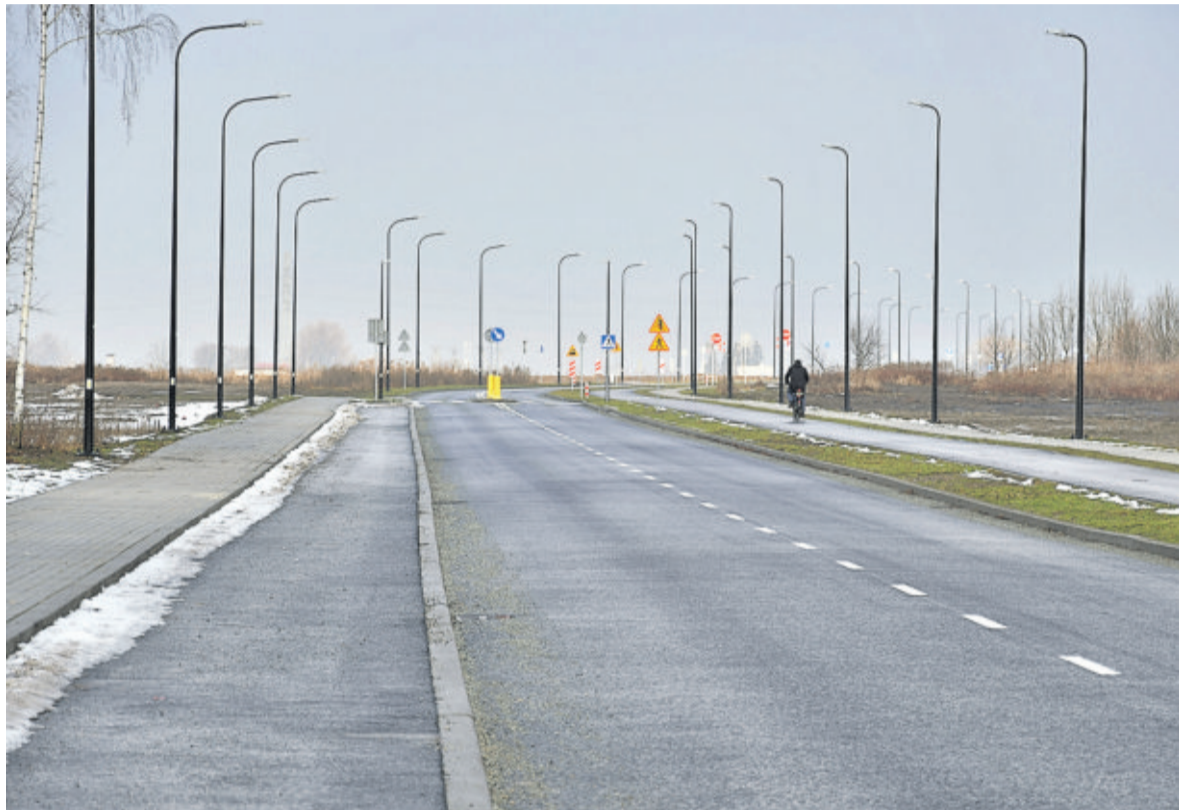
Kierowcy, rowerzyści i piesi testowali nowy odcinek obwodnicy od listopada. Teraz mogą z niego korzystać już oficjalnie