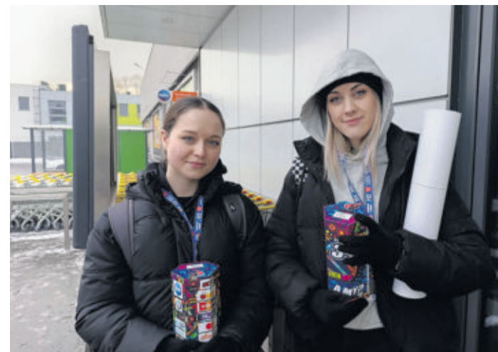
Uczennice z Kopernika na posterunku