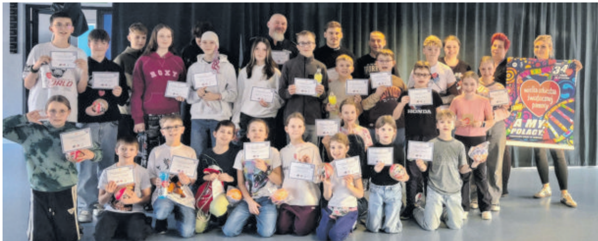
Akcja „Dzielnicowi kontra uczniowie – sportowo dla WOŚP” bardzo się spodobała jej uczestnikom