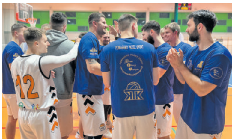
Fot. arch. KTK JS Invest Knurów

XXXVI GRAND PRIX KNUROWA W SKACIE SPORTOWYM