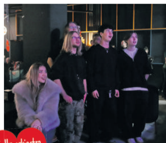
Stanisław Salwa przekazał na licytację cenne winyle ze swojej kolekcji