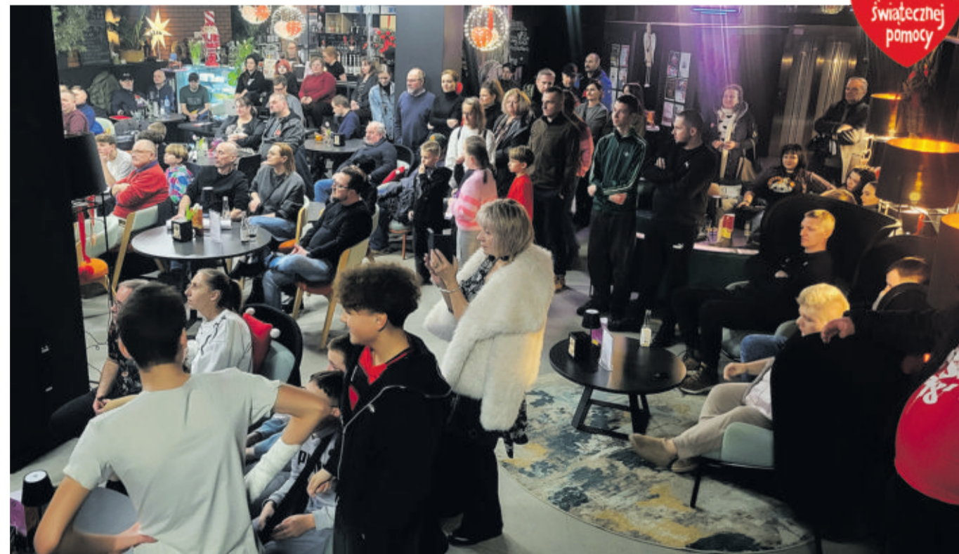
Art CK wypełniało się gośćmi z minuty na minutę...