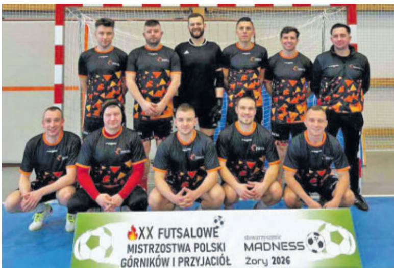
Wśród górników nie brak dobrych piłkarzy. Na zdjęciu wicemistrzowie Polski z KWK Knurów-Szczygłowice