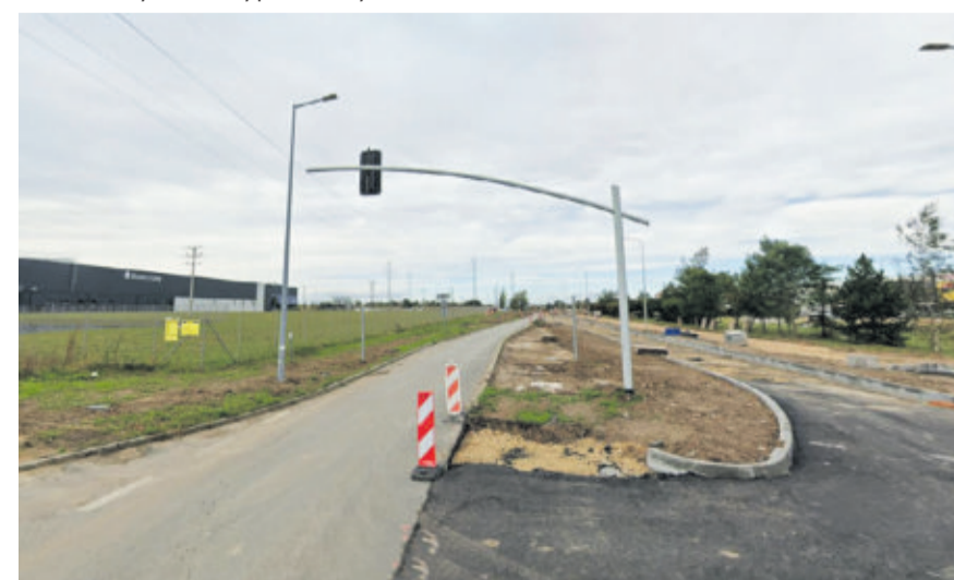
W 2026 roku sfinalizowane zostaną prace w rejonie terenów inwestycyjnych