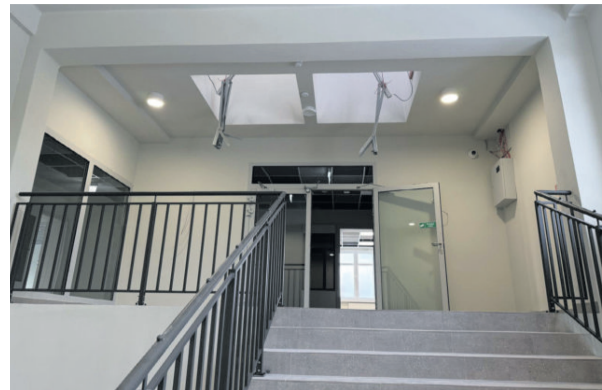
Postępują prace modernizacyjne w szkolnej „dziewięćce”