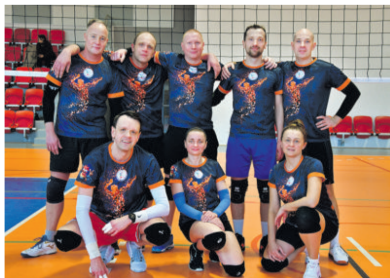
GKP Niedzielni Siatkarze