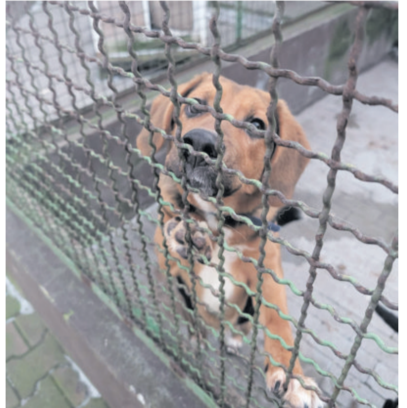
Wkrótce schronisko ma wrócić do pełnej procedury adopcyjnej

Knurów skala zjawiska nie jest duża - średnio rocznie jest odławianych około dwadzieścia psów, z czego mniej więcej siedemdziesiąt procent jest odbieranych przez ich właścicieli.