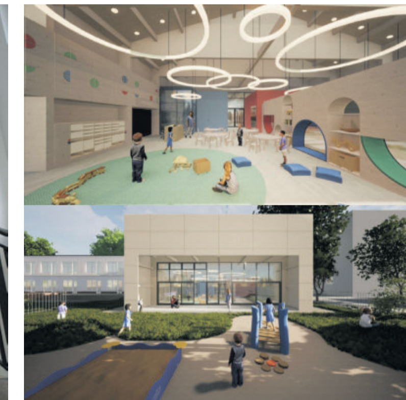
W Szczygłowicach powstanie oddział żłobkowy