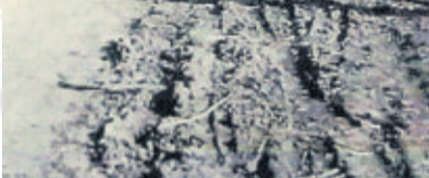
Szosa gliwicko-mikołowska w okresie międzywojennym; po obydwu stronach wysadzona leśnymi drzewami liściastymi, a w terenie zabudowanym także czereśniami