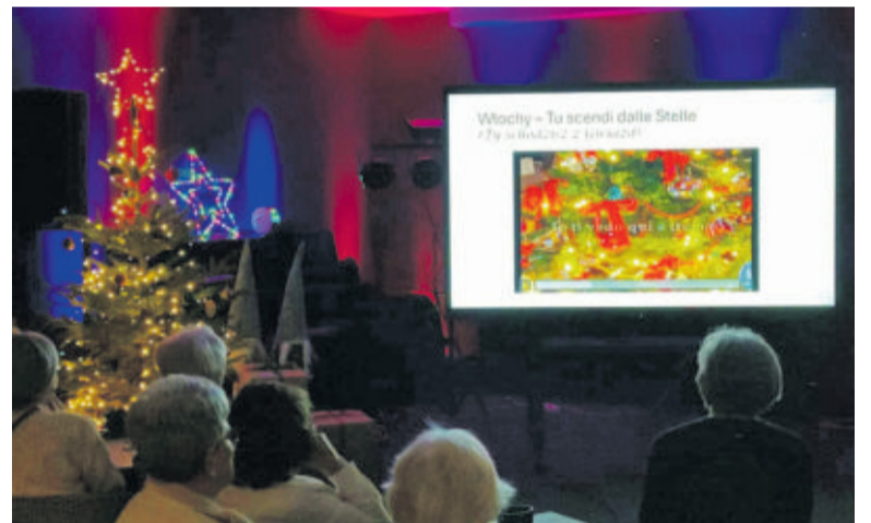
Wirtualna podróż z kolędą przez świat przyciągnęła do Sztukaterii liczne grono żaków KUTW