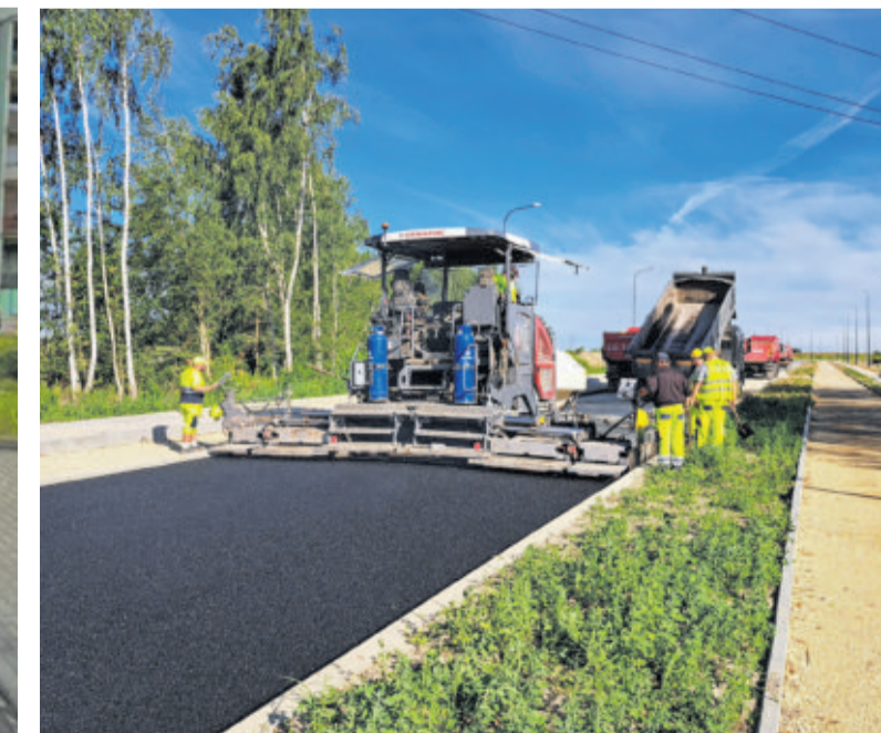
Kontynuowana jest budowa obwodnicy Knurowa - w 2026 roku połączenie zyskają ulice Szpitalna z Rakoniewskiego / fot. Michał Piszer