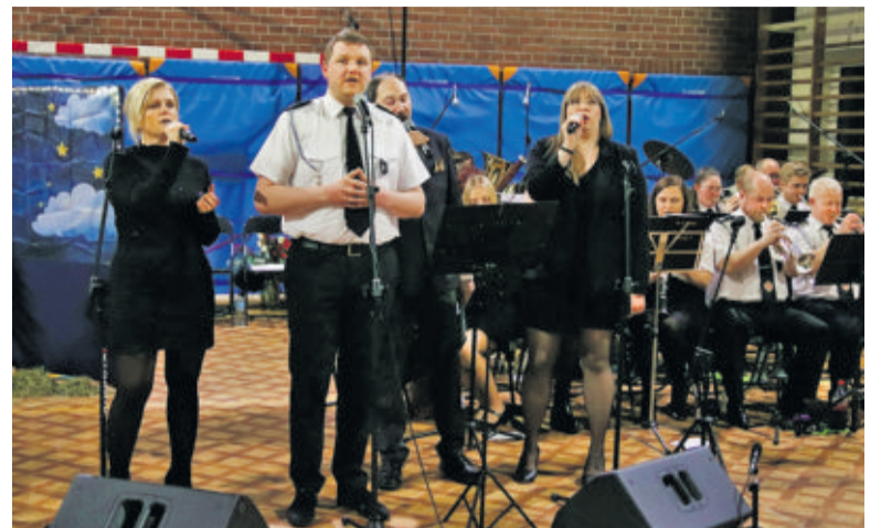
Na koncertach w Przyszowicach i Paniówkach można było posłuchać kolęd w wykonaniu miejscowych solistów z towarzyszeniem znakomitej orkiestry dętej OSP Przyszowice

Obecni mogą potwierdzić, iż okazji do wspólnego śpiewania nie