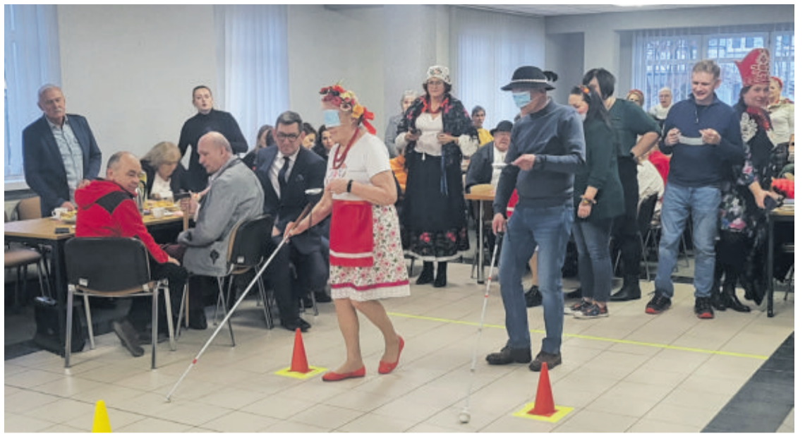
Rywalizacji przyglądali się goście, wśród których nie mogło zabraknąć prezydenta Tomasza Rzepy

Tradycji stało się zadość - członkowie Koła TRION spotkali się na noworocznym turnieju w góralskim stylu. Było gwarno i wesoło