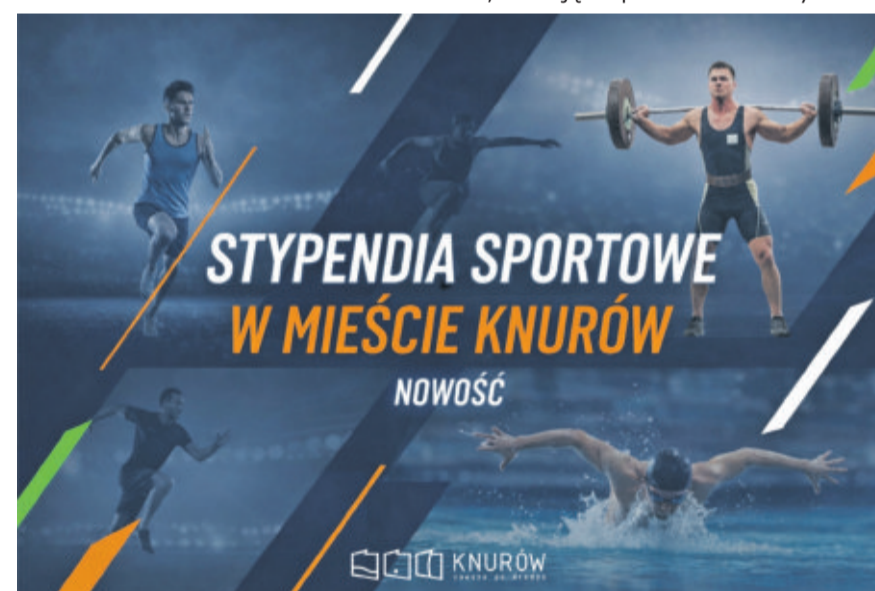
Miasto docenia aktywność mieszkańców - m.in. w 2026 roku uruchomiony zostanie system stypendialny