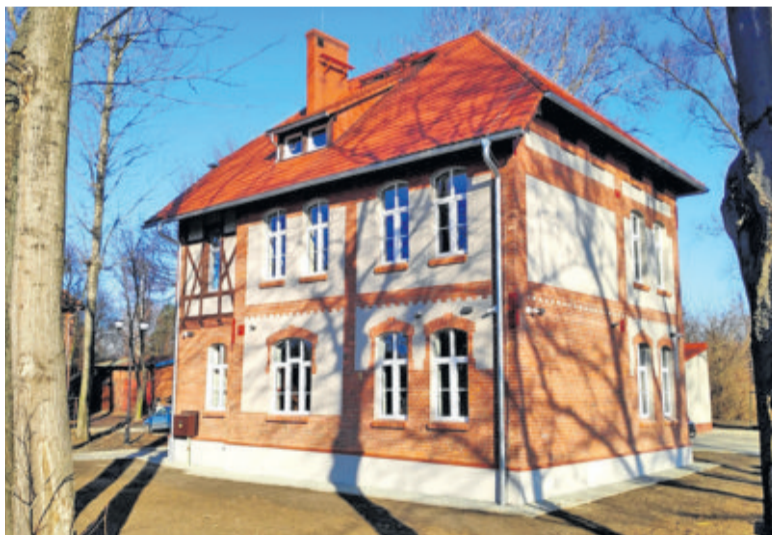
Radcowie prawni dyżurują w Centrum Wsparcia Inicjatyw Społecznych przy ul. Dworcowej 33 w Knurowie

Nieodpłatna pomoc prawna przysługuje każdej osobie uprawnionej, która złoży oświadczenie, że nie jest w stanie ponieść kosztów odpłatnej pomocy prawnej. Mogą z niej korzystać także osoby fizyczne prowadzące jednoosobową działalność gospodarczą i niezatrudniające innych osób w ciągu ostatniego roku. Pomoc w punkcie otrzymują również sygnaliści, czyli osoby, które chcą zgłosić nieprawidłowości, naruszenia prawa lub nadużycia w miejscu pracy, instytucji publicznej lub organizacji. Sygnalista nie składa oświadczenia, o którym