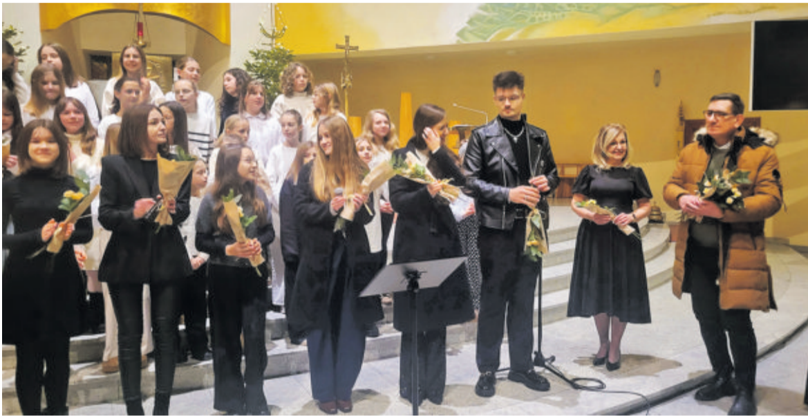
Kolędowanie było okazją do pokazania się uzdolnionych młodych artystów... w iście świątecznym stylu

Styczeń obfituje w okazje do słuchania i wspólnego śpiewania kolęd. Poniżej relacja z koncertów, jasełek i okolicznościowych spotkań przywołujących atmosferę świąt