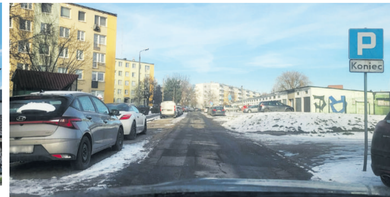
Gruntownej przebudowie zostanie poddana ul. Mieszka I