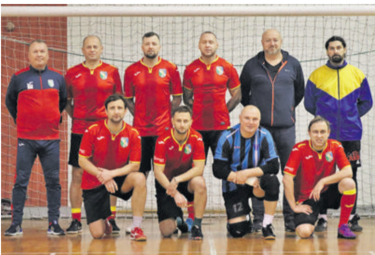
Drużynie MTS-u Knurów zabrakło niewiele do zdobycia medalu mistrzostw Polski

W weekend odbyły się dwie mistrzowskie imprezy w halowej odmianie piłki nożnej