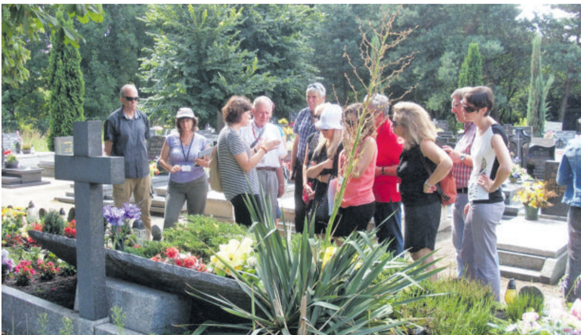
Rok 2014: wycieczka z Izraela przed zbiorową mogiłą pomordowanych 27 stycznia 1945 r. w Przyszowicach

Krystyna Augustyniak Fot. archiwum autorki