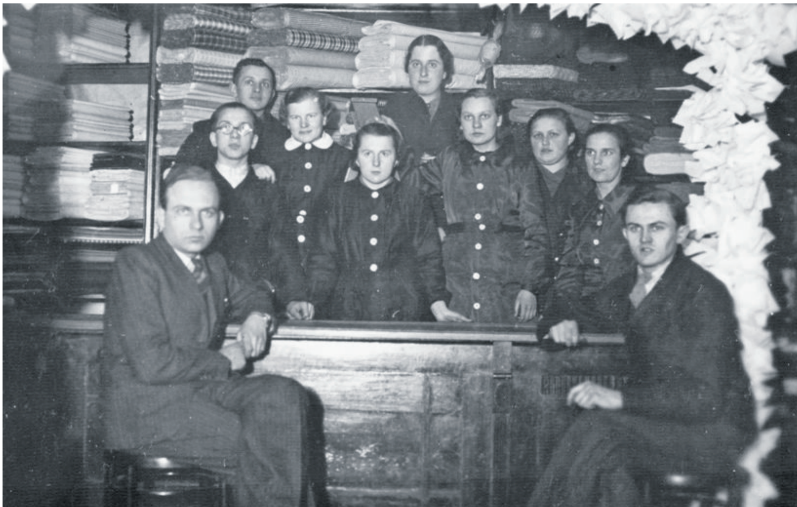
Personel pracujący w sklepie tekstylnym Wischnitzerów przy ul. Rybnickiej 17 w Knurówie

Jeśli ktokolwiek posiada jakiegokolwiek informacje, dokumenty, przedmioty, fotografie lub wspomnienia związane z knurowskimi Żydami, proszony jest o kontakt z autorem artykułu. Czasem nawet zasłyszane opowieści lub plotki mogą mu pomóc w uzupełnieniu opowieści o wielokulturowym i wielonarodowościowym Knurówie. Zachęcamy do kontaktu poprzez e-mail: plipin@go2.pl lub telefonicznie: 603 363 736.