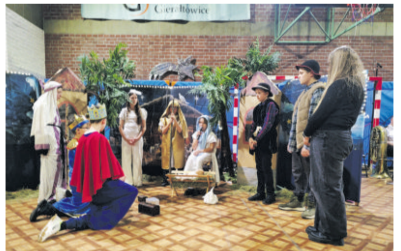
Jasełka w Przyszowicach – wystawili je uczniowie i nauczyciele miejscowej podstawówki