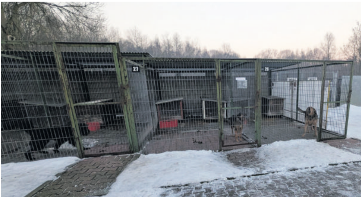
19 stycznia, bezpośrednią opiekę nad schroniskiem przejęła gmina Bytom. - Zwierzęta są zaopiekowane, pod kontrolą, chronione przed mrozem, nakarmione i napojone - zapewnia Mariusz Wołosz