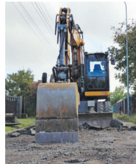
W Farskich Polach budowana jest kanalizacja sanitarna - zakończenie prac w ciągu dróg przewidywane jest pod koniec lata