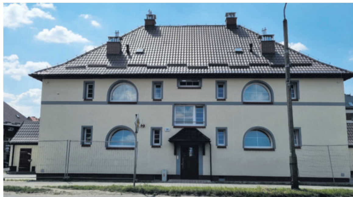
Dzięki staraniom samorządu najstarszy rejon Knurowa odzyskuje dawny blask - w 2026 roku przebudowie zostaną poddane kolejne wiekowe budynki; na zdjęciu zmodernizowana kamienica przy ul. Dworcowej