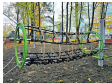
Na atrakcyjności zyskiwać będą place zabaw; na zdjęciu plac zabaw w Krywałdzie