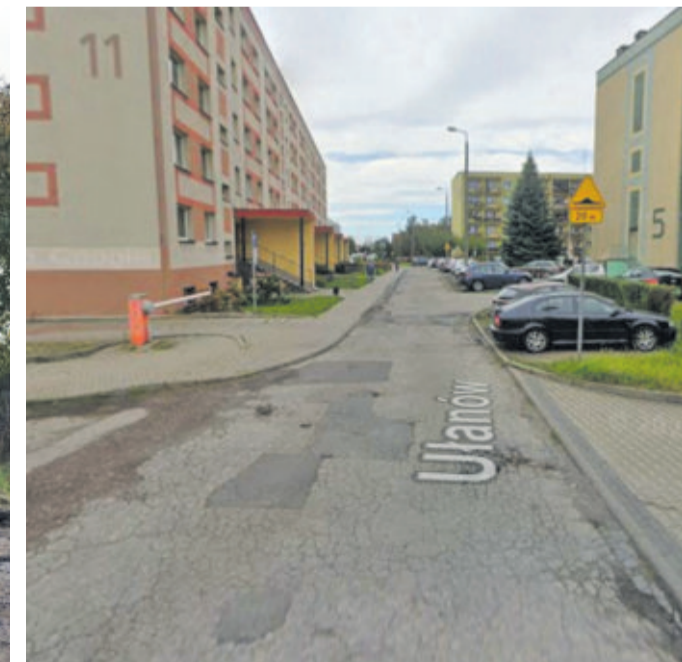
Modernizacji poddany zostanie odcinek ul. Ulanów oraz ul. Sikorskiego