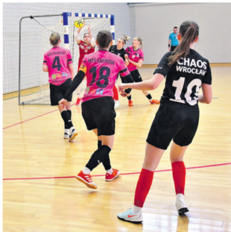
Wbrew swojej nazwie Chaos Wrocław grał poukładaną piłkę