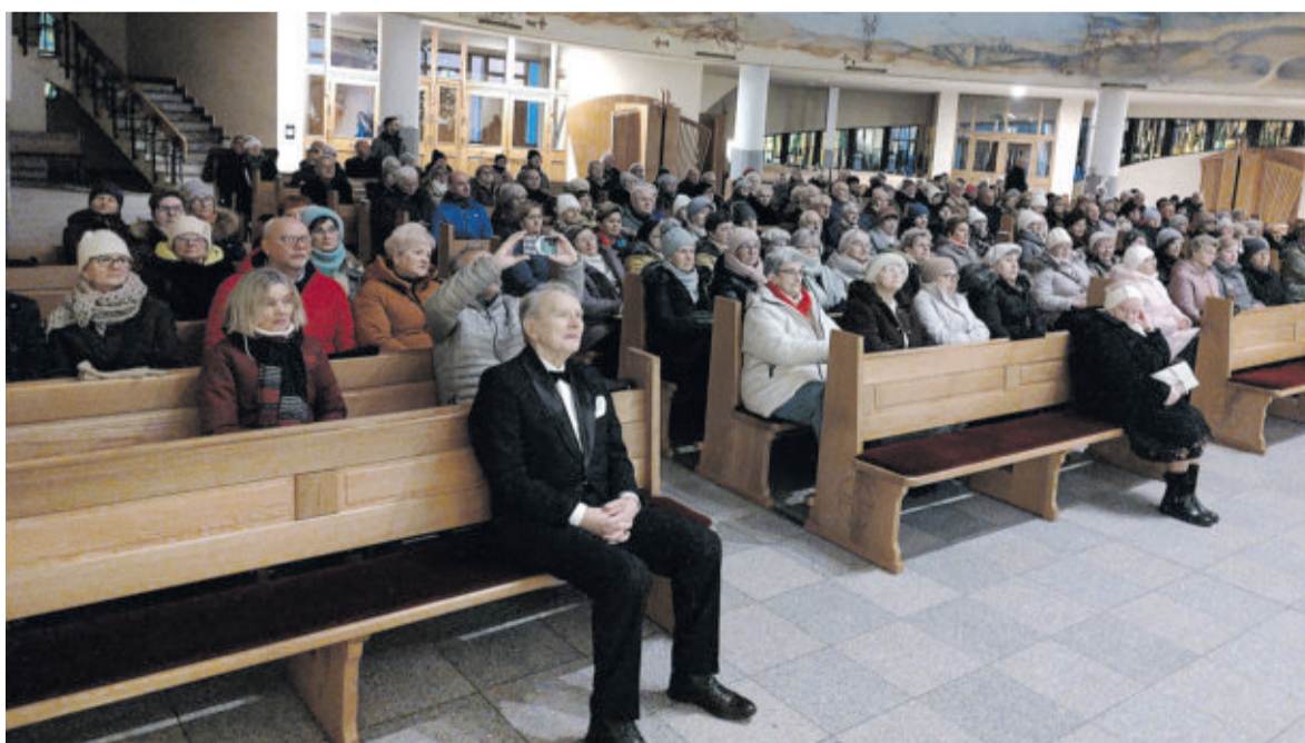
Wykład w formie koncertu spotkał się ze sporym zainteresowaniem - w kościelnych ławach zasiedli nie tylko żacy Knurowskiego Uniwersytetu Trzeciego Wieku, ale i słuchacze spoza uczelnianej społeczności

Koncert i wykład w ramach Knurowskiego Uniwersytetu Trzeciego Wieku przyciągnął w minioną środę do kościoła Matki Bożej Częstochowskiej liczne grono słuchaczy