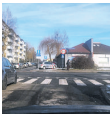
Ul. Mieszka I

Przebudowa ul. Mieszka I kosztować będzie około 2,5 mln zł , ul. Szkolnej – 850 tys. zł .