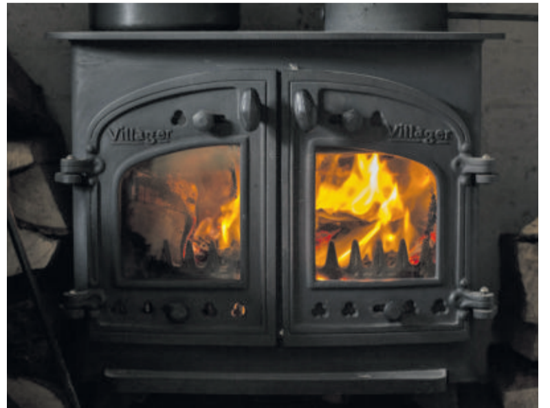
Fot. Davey Davidson / pixabay.com

Ryzyko zatrucia można zminimalizować, instalując w domu