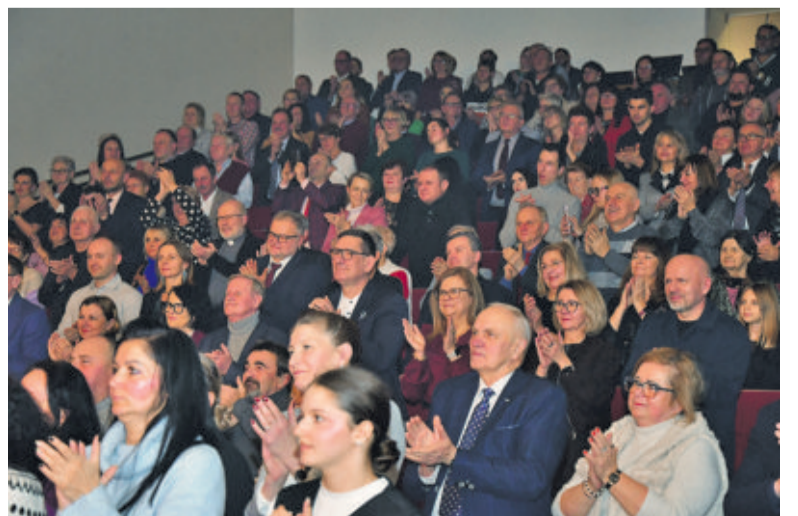
Publiczność nagrodziła artystów owacją na stojąco