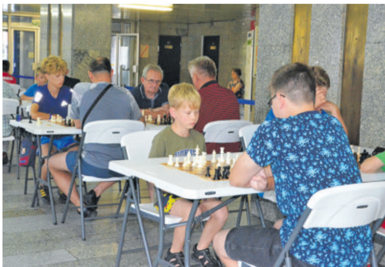
Liga Szachowa ruszy już 17 lutego