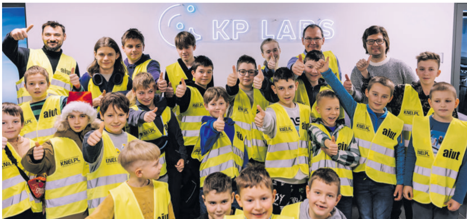
Członkowie KNEI byli bardzo zadowoleni z wycieczki

- Aby zbudować komputery, które będą odporne na bardzo trudne warunki pracy na orbicie, trzeba w jednym miejscu zgromadzić odpowiednią kadrę inżynierską oraz zaplecze techniczne pozwalające projektować, budować i testować urządzenia przed wysłaniem ich w kosmos – mówi Donat