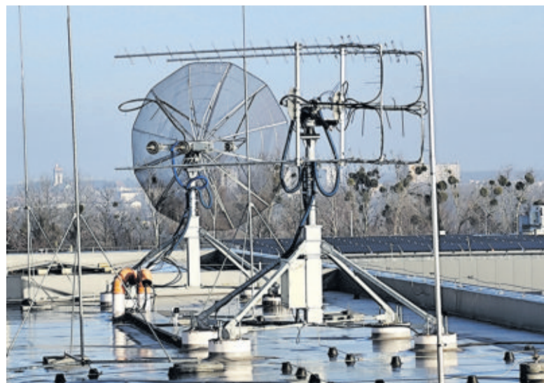
Sygnal do satelity został wysłany poprzez anteny znajdujące na dachu siedziby firmy KB Labs