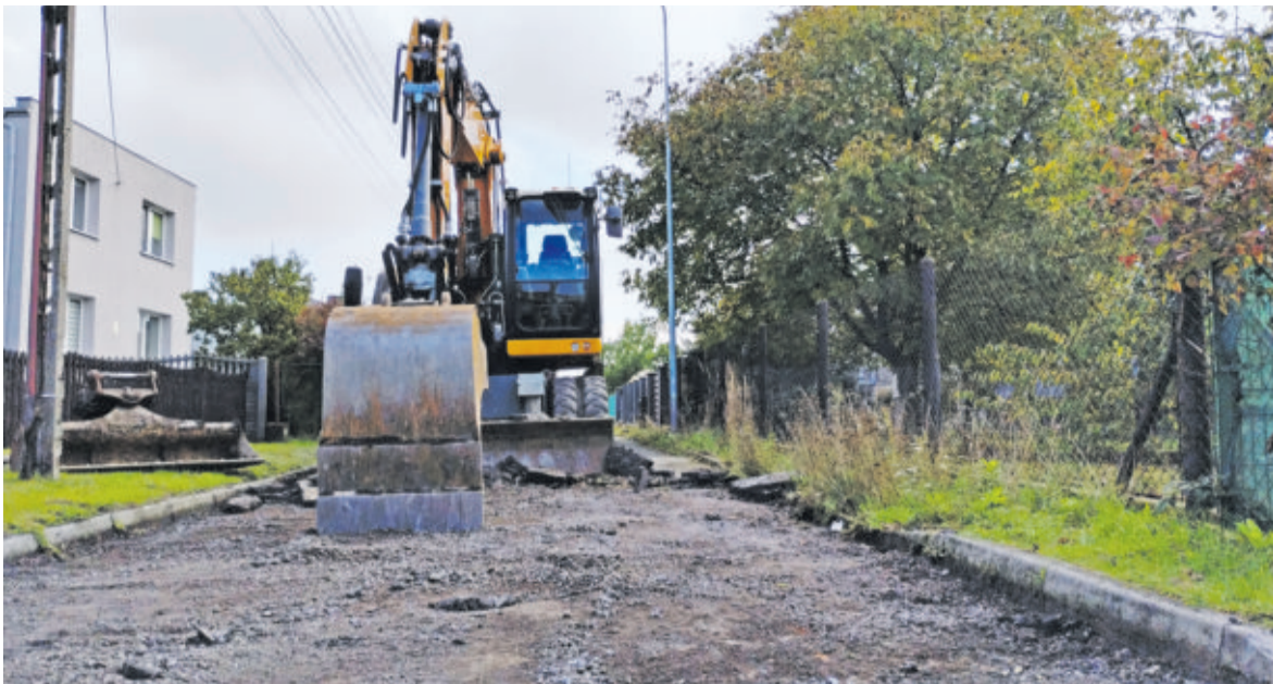
Jeśli nic nie przeszkodzi, budowa kanalizacji w ciągach dróg na Farskich Polach zostanie zakończona do końca sierpnia; zdjęcie z października