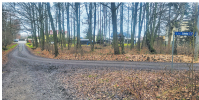
Fragment ul. Szkolnej, który zostanie zmodernizowany