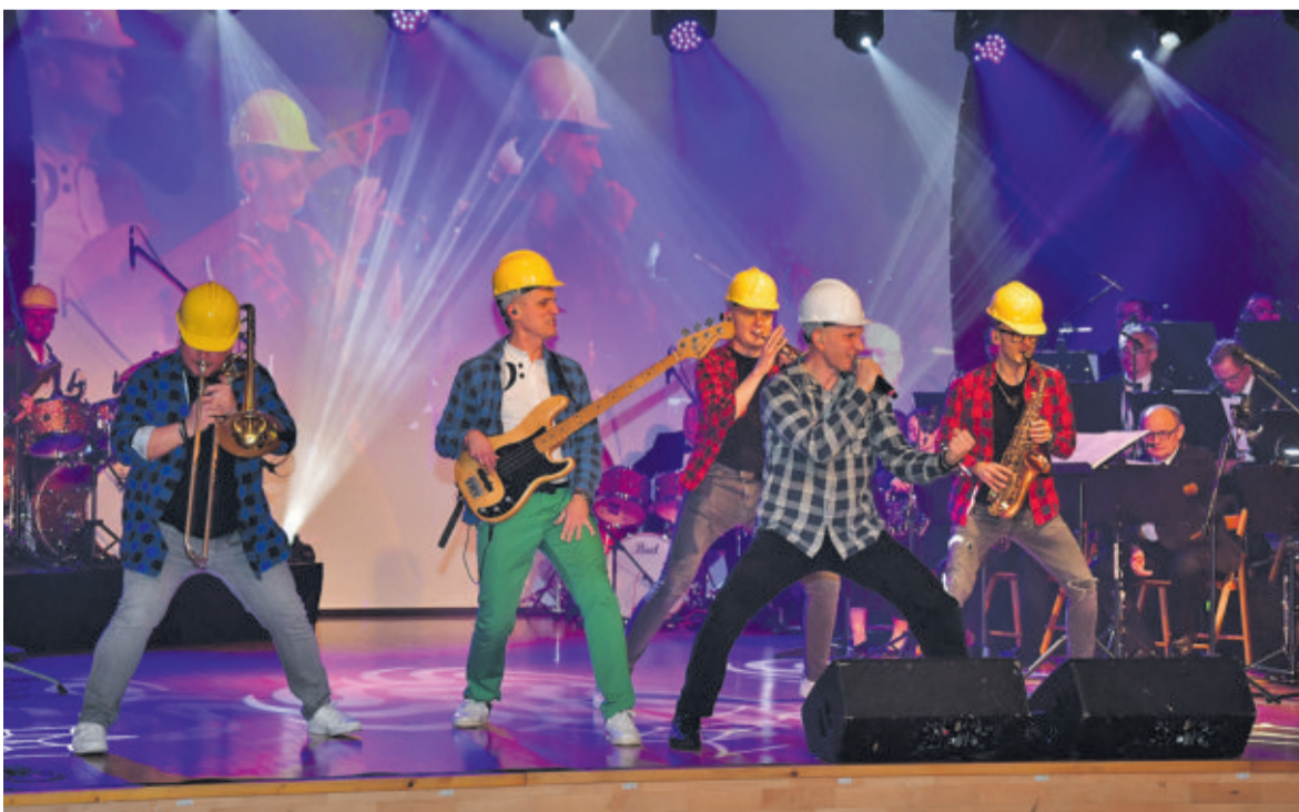
Roszak Show w scenicznej akcji