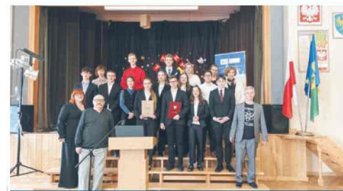
Energia jądrowa pod lupą młodzieży str. 4