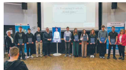
Sztuczna inteligencja w centrum uwagi str. 4