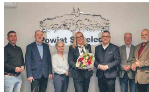
Złote wyróżnienie dla schroniska w Górze Św. Anny str. 5