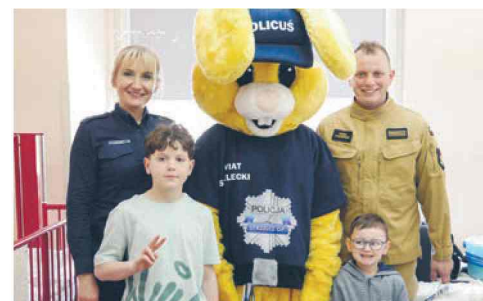
Zajączek Policuś odwiedził małych pacjentów str. 6