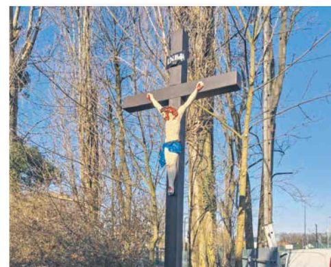
Przetwał dzięki ludziom... str. 2