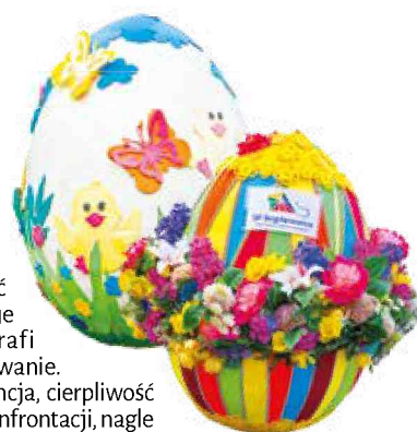
Wielkanocne dekoracje wykonane przez młodzież głubczyckich placówek oświatowych