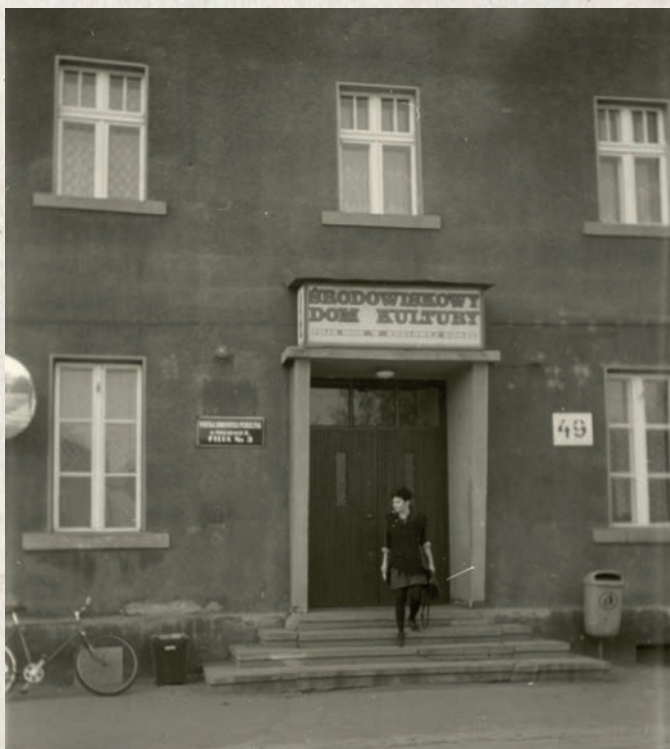
Budynek przy ul. Tarnogórskiej 49 w Kozłowej Górze przed termomodernizacją