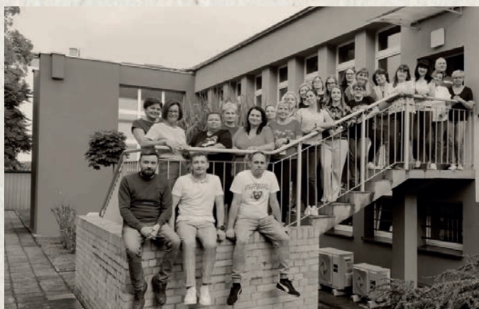
Biblioteczny ogródek przy ul. Kalwaryjskiej, IX 2025