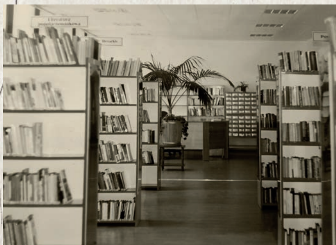
Wypożyczalnia w 1998 r.

Działają u nas Klub Mangi, Klub Małych Bystrzaków, Młodzieżowy Klub Książki i Biblioteka Podróżnika. Można przyjść po książkę, a wyjść... z nową pasją. Niezależnie od wieku każdy może spróbować u nas czegoś nowego – wspólnie tworzymy wiersze, malujemy obrazy, uczestniczymy w warsztatach i spotkaniach.