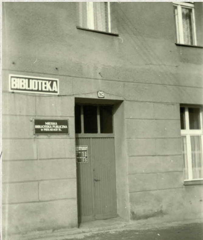
Dawna siedziba Filii nr 2 przy ul. Bytomskiej 162

Od początku działalności nasza biblioteka starała się dbać o dobro swoich czytelników – nie tylko polecając ciekawe lektury, ale także oferując szeroki zakres spotkań dotyczących kultury i literatury. W zależności od możliwości lokalowych organizowano wieczory autorskie, wystawy, imprezy okolicznościowe, konkursy i wieczory czytania bajek, także wyświetlanych na przeźroczach. Bibliotekarki dokładały wszelkich starań, aby wspierać czytelnictwo, m.in. nosiły po kilkadziesiąt książek do jednego z przedszkoli, aby dzieci mogły je wypożyczać.