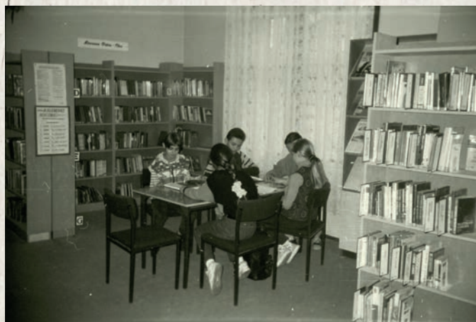
Dzieciństwo w latach 90. spędzało się w bibliotece. Wspólne czytanie w jednej z piekarskich bibliotek...