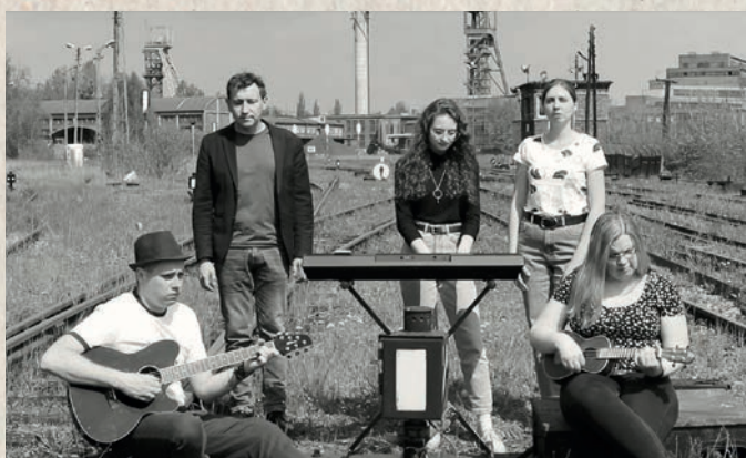
Teodorki i Heneczki w trakcie nagrywania teledysku