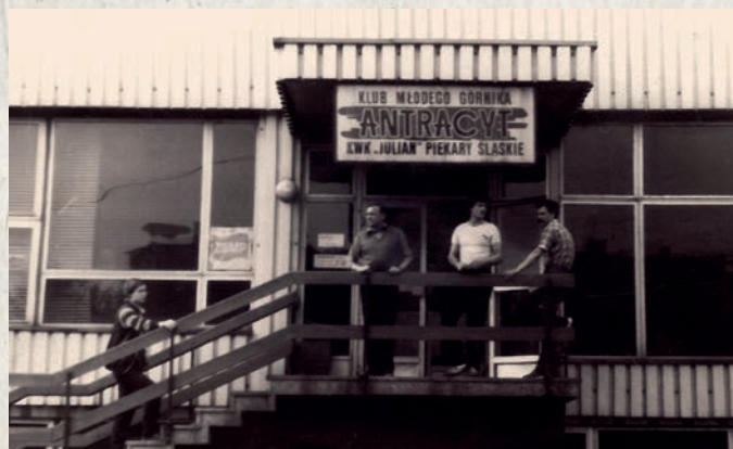
Klub „Antracyt” przy dawnej ul. Moja i Gawlicy, lata 80.

W chwili usamodzielnienia, 31 grudnia 1975 roku, biblioteka wraz z filiami posiadała 92141 woluminów i zarejestrowała 6771 czytelników. Dwa lata później uruchomiono punkt biblioteczny przy Szpitalu Miejskim. Wtedy też filia w Kozłowej Górze otrzymała dodatkowe pomieszczenie. Nadal jednak brakowało oddziałów dziecięcych i działu bibliograficzno-informacyjnego. Także liczba filii była niewystarczająca wobec postępującej rozbudowy piekarskich osiedli. Tak powstawały kolejne placówki MBP na Osiedlu Powstańców Śląskich, punkt biblioteczny w siedzibie Miejskiego Ośrodka Sportu i Rekreacji, oraz po zmianach lokalowych Oddział dla Dzieci i Młodzieży w Szarleju. W 1990 roku do nowego miejsca przeniesiono Filię nr 6 w Brzozowicach-Kamieniu i uruchomiono pierwszą w mieście czytelnię naukową i prasy, a rok później – tam też – dział muzyczny i książki mówionej. Ogromnym sukcesem w tamtym czasie było otwarcie kolejnej osiedlowej filii na Józefce.