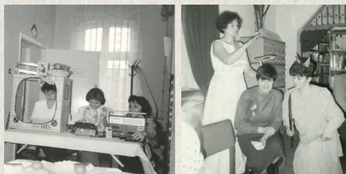
Przedstawienia teatralne w wykonaniu pracownic biblioteki

Filia nr 6, funkcjonująca w dzielnicy Brzozowice-Kamień od 1945 roku, swoją działalność w obecnym przestrzennym miejscu, tj. na ulicy Partyzantów, prowadzi od roku 1990, kiedy to jej zbiory przeniesiono z budynku przy ulicy Nankera. Nowoczesny na ówczesne czasy lokal, bogate zbiory, zaangażowani pracownicy i nowe trendy w pracy z czytelnikami sprawiły, że „Szóstka” stała się tętniącym życiem lokalnym centrum kultury. Od lat staramy się proponować społeczności szereg wydarzeń promujących czytanie i inne metody wartościowego spędzania czasu, naukę i rozrywkę. Dzięki przychylności władz miasta, a także dzięki wsparciu stowarzyszenia Koło Przyjaciół Biblioteki przy naszej filii udało nam się w bibliotece zorganizować wiele ciekawych wydarzeń, konkursów, warsztatów, a zwłaszcza spotkań z interesującymi osobami – przedstawicielami świata literatury.