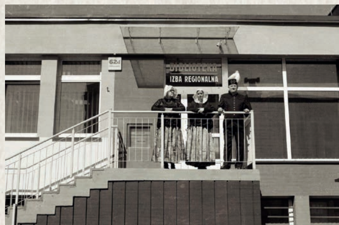
Biblioteka Centralna przy obecnej ul. Kalwaryjskiej, 2024

Mimo że w ciągu wielu lat istnienia biblioteki warunki lokalowe ulegały stopniowej poprawie, dopiero w 1998 roku udało się pozyskać budynek po klubie „Antracyt”. Został on zaadaptowany dla potrzeb bibliotecznych, by umożliwić funkcjonowanie Biblioteki Centralnej, a w jej strukturze Wypożyczalni dla dorosłych, Czytelni naukowej i prasy, Oddziału dla dzieci i młodzieży