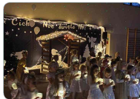
Świąteczny występ w Boguszycach

Dziękujemy Wojewódzkiemu Funduszu Ochrony Środowiska i Gospodarki Wodnej w Opolu za wsparcie i zaufanie. Cieszymy się, że wspólnie możemy działać na rzecz klimatu, środowiska i jakości życia w Gminie Prószków!