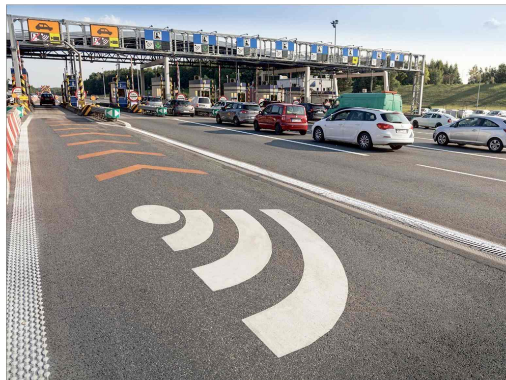
■ A4 stanie się bezpłatna i zostanie rozbudowana na niemal 120 kilometrach.