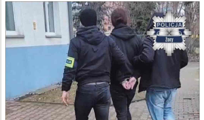
■ Mężczyzna był poszukiwany w związku z przestępstwami narkotykowymi i oszustwami.

Młody mężczyzna, który od kilku lat unikał odpowiedzialności, został zatrzymany we Wrocławiu przez żorskich kryminalnych.