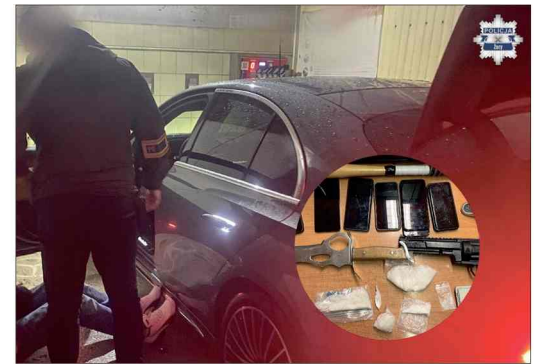
■ Funkcjonariusze znaleźli narkotyki i przedmioty przypominające broń.

Podczas interwencji kierowca uruchomił silnik, a pasażer nerwowo sięgnął za siedzenie, co wymagało natychmiastowej reakcji po-