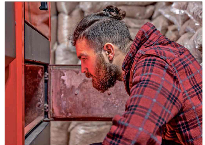
■ Pellet zniknął z wielu składów opału, a sprzedawcy nie potrafią wskazać terminu dostaw. Klienci słyszą o ograniczeniach, reglamentacji i cenach sięgających 3000 zł za tonę.

Braki pelletu rodzą coraz większą frustrację wśród mieszkańców. Część z nich wprost mówi o poczuciu oszukania. – Zainwestowaliśmy wiele tysięcy złotych