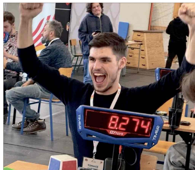
Turniejowi towarzyszyły wielkie emocje. Uczestnicy musieli wykazać się umiejętnością logicznego myślenia oraz nie lada zręcznością.

Rywalizacja toczyła się w 11 oficjalnych konkurencjach World Cube Association, a największe emocje tradycyjnie wzbudzała konkurencja 3×3×3. Zwyciężył w niej Radosław