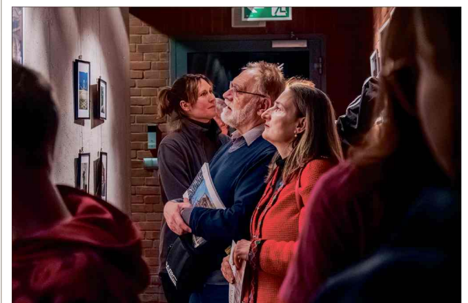
■ Na wystawie, obok fotografii, prezentowane są również wywiady przygotowane przez uczestników w dwóch wersjach językowych: polskiej i ukraińskiej. Ekspozycja zajmuje dwa piętra muzeum i jest dostępna dla zwiedzających do końca lutego.

mowej aury udało się przeprowadzić cykl spotkań, podczas których uczestnicy poznawali historię miejskiego muzeum, dworca kolejowego oraz biblioteki.