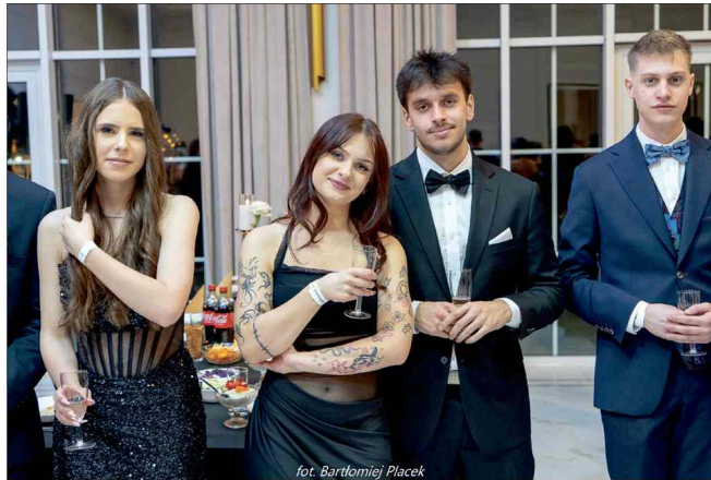
■ Studniówka tegorocznych maturzystów z Technikum nr 1 w Żorach, 30.01.2026 r.