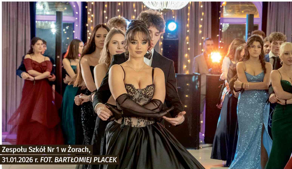
Zespołu Szkół Nr 1 w Żorach, 31.01.2026 r.