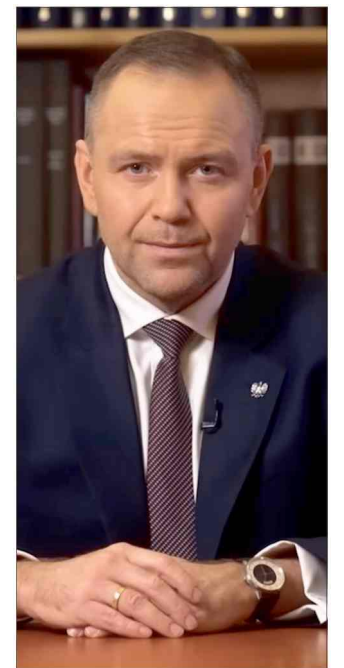
Prezydent zdecydował o zawetowaniu ustawy nadającej językowi śląskiemu status języka regionalnego.