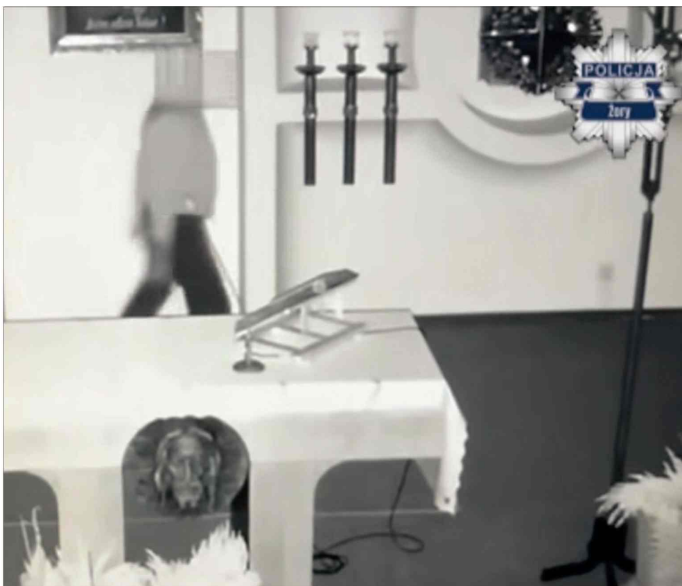
■ Ukradł pieniądze, wypił wino i zdemolował zakrystię. Grozi mu 10 lat.

Na miejscu pracowali kryminalni, którzy przeprowadzili szczegółowe oględziny, zabezpieczyli ślady i zapis z monitoringu. Analiza nagrań nie pozostawiła wątpliwości – mężczyzna skradł pieniądze ze skarbonki oraz butelkę wina mszalnego, które na-