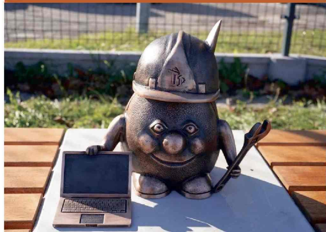
■ W Żorach stanęła kolejna figurka Żorka.

W Żorach pojawił się nowy Żorek – tym razem jako profesjonalista. Figurkę, odsłoniętą z okazji 50-lecia Technikum nr 1, można już podziwiać przed budynkiem szkoły.