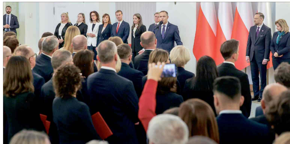
■ Wręczenie aktów powołania nowym sędziom i asesorum.

Według Onetu część sędziów z listy podpisywała apele dotyczące sytuacji w wymiarze sprawiedliwości, w tym te dotyczące wykony-