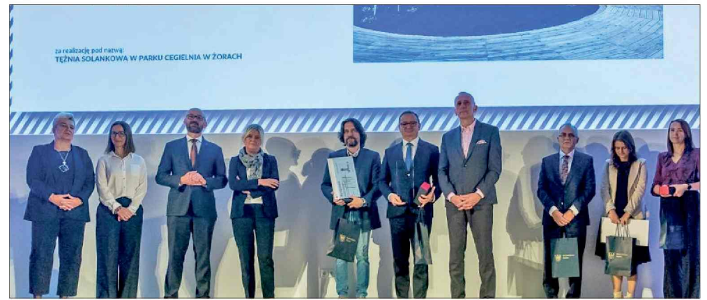
■ Tężnia w Żorach została wyróżniona w konkursie na Najlepszą Przestrzeń Województwa Śląskiego.

Podczas gali w Muzeum Śląskim w Katowicach nagrody wręczył wicemarszałek województwa Leszek Pietraszek, który podkreślił znaczenie konkursu: