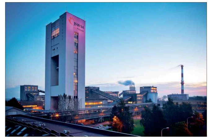
■ KWK Pniówek, FOT. ZDJ. ILLUSTRACYJNE

JSW kontynuuje przygotowania do realizacji planu restrukturyzacji biznesowej. Cel spółki to uproszczenie struktury organizacyjnej, ograniczenie kosztów administracyjnych