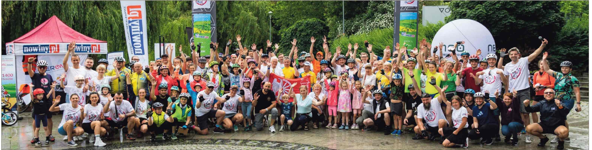
■ Zapraszamy wszystkich do udziału w 6. edycji RowerON 2026!

„Wsiadaj na koło, będzie wesoło” – pod takim hasłem przez ostatnie 6 miesięcy mieszkańcy całego subregionu zachodniego województwa śląskiego (powiat raciborski, wodzisławski, rybnicki, Żory i Jastrzębie-Zdrój) oraz powiatu gliwickiego, pszczyńskiego, mikołowskiego, cieszyńskiego, bielskiego i czeskiej Opawy i Karwiny jeździli po 16 wytypowanych trasach rowerowych w regionie. W czwartek 6 listopada o godz. 13:00 odbył się finałowy LIVE i tym samym zakończyliśmy V edycję największego wyzwania rowerowego RowerON 2025.