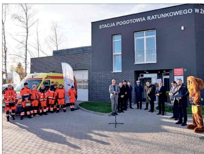
■ Oficjalne otwarcie nowoczesnej Stacji Pogotowia Ratunkowego przy zbiegu Alei Jana Pawła II i alei Zjednoczonej Europy.