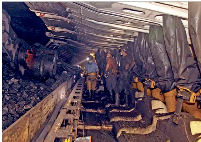
■ Szacuje się, że z urlopów górniczych skorzysta około 3,5 tys. osób.

Rząd przyjął projekt nowelizacji ustawy górniczej. Dokumenty trafią pod obrady parlamentu. Pracownicy mogą uzyskać m.in. urlopy górnicze z wynagrodzeniem w wysokości 80 proc. pensji i jednorazowe, nieopodatkowane odprawy pieniężne w kwocie 170 tys. zł.